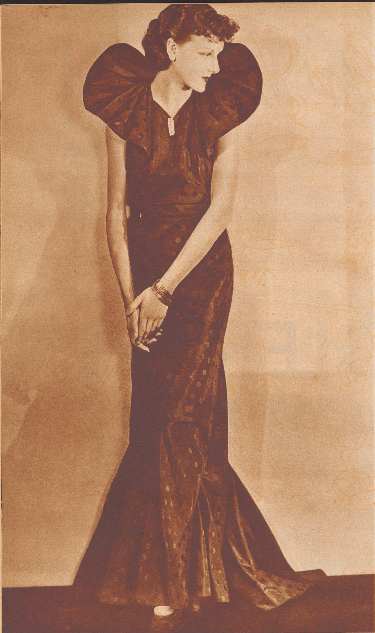
Schwarzes Abendkleid aus getupftem Taffet. Modell Grieder