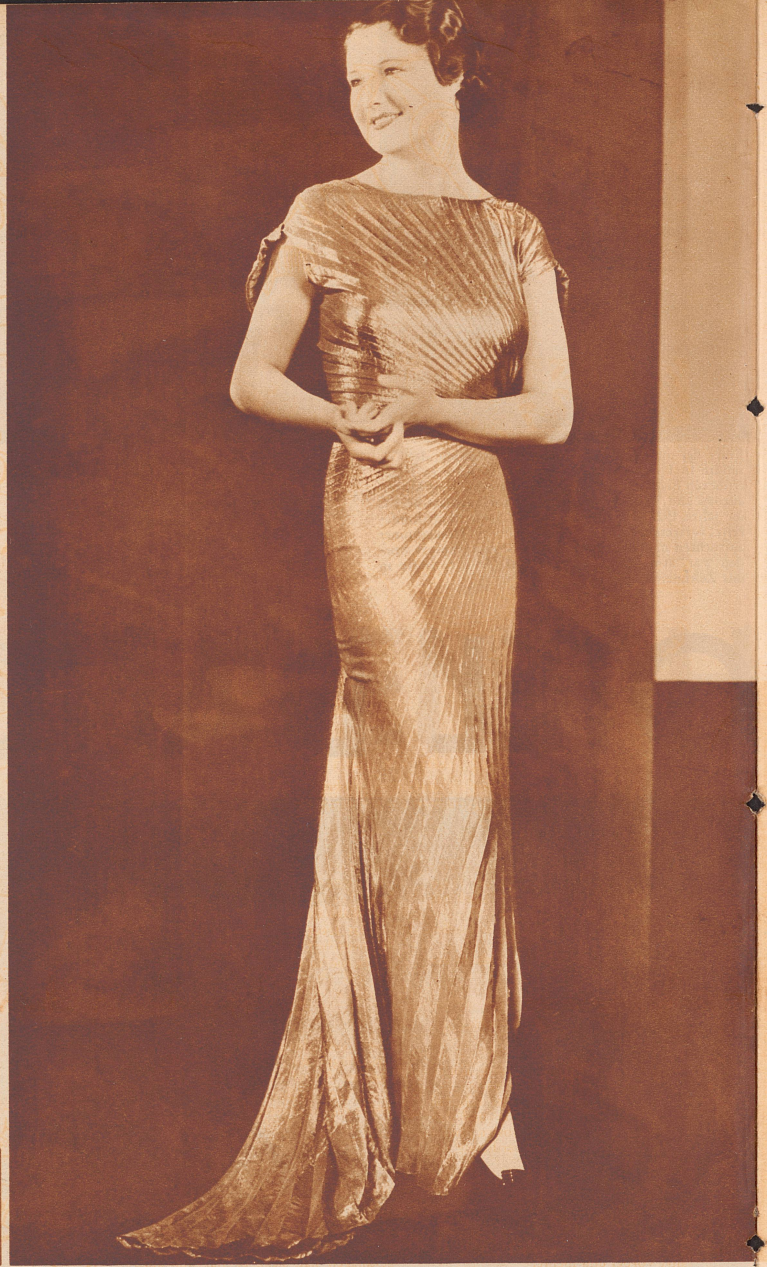
Elegantes Abendkleid aus grün- goldener Lamé, ganz in Plissé- Soleil ausgeführt. Modell Grieder