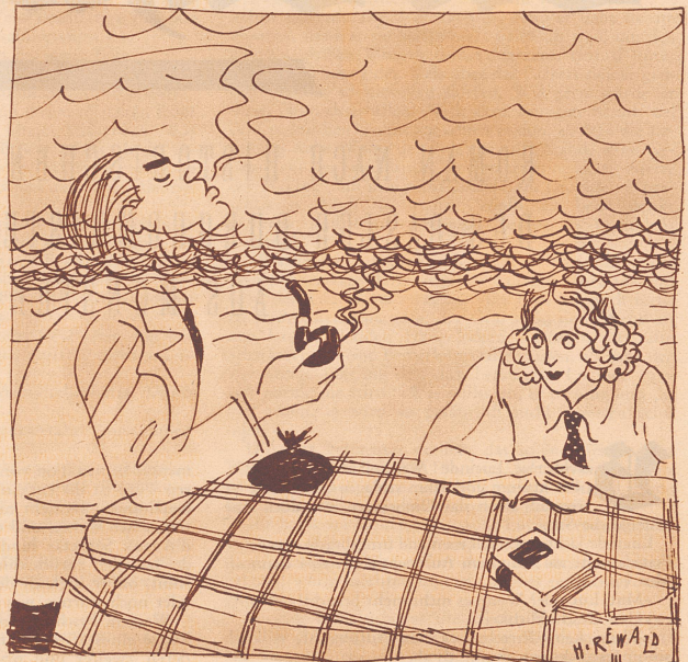
Ehezwit Zeichnung von H. Rewald

Der Seidenstoff. Inge betritt mit ihrem Großmütterchen das Seidengeschäft der kleinen Landstadt.