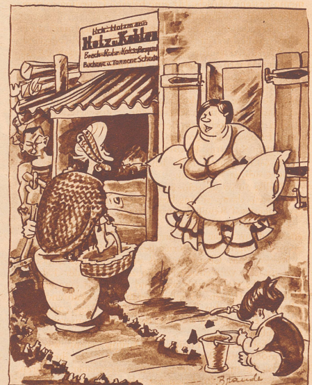
«Ihr Mann ist jetzt dem Feuerbestattungsverein beigetreten?» «Als Kohlenhändler konnte er doch nicht gut anders!» Zeichnung von Brandt

Der Chef: «Drei Tage Urlaub, um Ihrer Frau beim Großreinemachen zu helfen? Ausgeschlossen, ganz ausgeschlossen!» Der Angestellte (zu Tränen gerührt): «Ich danke Ihnen, ich wußte ja, daß ich mich auf Sie verlassen kann.»