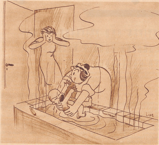
Madame: «Um Gottes willen, Mathilde, die Temperatur ist doch viel zu hoch für das Kind...!» Mädchen: «Mein Gott, was versteht denn so ein kleines Kind von der Temperatur!» Zeichnung von R. Lips