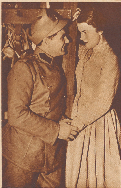
Attila Hörbiger und Paula Wesseley, zwei bekannte und beliebte Schauspieler, die unzählige Male im Theater ein Paar zu spielen hatten, haben sich unlängst verheiratet. Bild: Paula Wesseley und Attila Hörbiger als Partner in der Aufführung des Stückes: «Die Braut von Torocko».

Prinz Georg, der jüngste Sohn des englischen Königspaares, hat sich mit der griechischen Prinzessin Marina noch nicht vermählt, aber verlobt. Endlich wieder einmal eine königliche Heirat, die mit beiderseitiger elterlicher Zustimmung erfolgen wird!