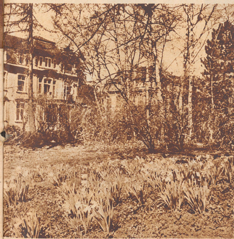
Im Belvoir-Park in Zürich haben dieses Jahr die gelben Narzissen 10 Tage früher zu blühen begonnen als voriges Jahr.

Für die Geschäftsleitung des Wanderbunds: W. Rietmann.