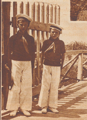
Das ganze Ferienlager ist von einem langen, langen Zaun umgeben. An den Türen aber halten während des ganzen Tages hübsche, weißbehaarte Matrosen abwechselnd Wacht.

Strand ist ein herrlicher Spielplatz, und kann man sich eine schönere Badegelegenheit denken als das Meer vor der Haustüre? An Regentagen aber geht es in dem großen Haus, wo etwa 1300 Kinder Platz haben, recht lustig zu. Denn auch die Zimmer und Wohnräume sind so gebaut und eingerichtet wie Kajüten und Schiffspeisesäle. Findet ihr nicht auch, daß ein solches Ferienheim am Meer etwas Fabelhaftes sei, und die kleinen Italiener, welche in diesem Hause aus allen Teilen der Welt einquartiert werden, lernen ihre Heimat gleich von der besten Seite kennen.