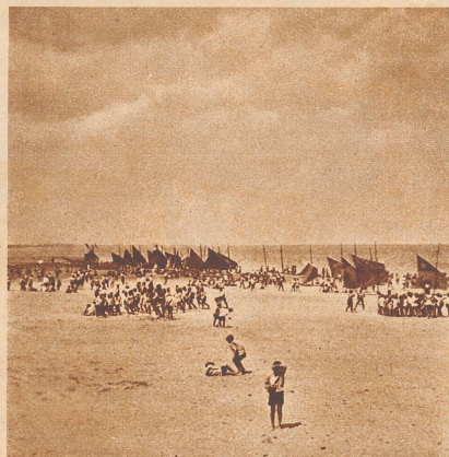
Der Badestrand zieht sich einige Kilometer weit am Adriatischen Meer hin. In Zelten werden während des Badens die Kleider aufbewahrt. Für Kinder, die aus Großstädten kommen, ist es wunderbar, während vielen Wochen nur Wasser, Sand und blauen Himmel zu sehen.

Es sind bereits ein paar Zeichnungen angekommen, aber noch viel zu wenig, dann hätte der Unggle Redakter zu viel Preise. Also, denkt darüber nach, was ihr etwa machen könnt und schickt eure Bilder bis spätestens am 28. September an die Redaktion der «Zürcher Illustrierten», Morgartenstraße 29, Zürich