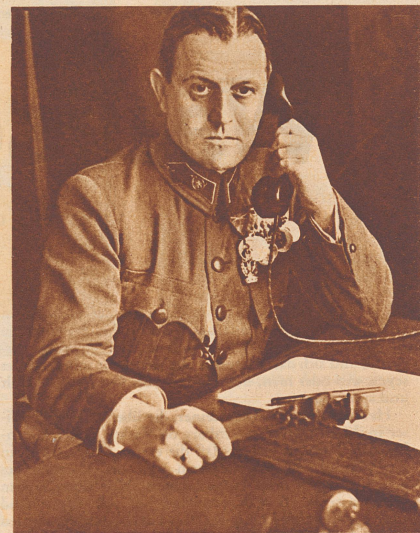
Der bis heute letzte Träger des Maria-Theresia-Ordens, der österreichische Bundesminister General Emil Fey. Er verdiente sich die Auszeichnung im Weltkriege an der Isonzofront.