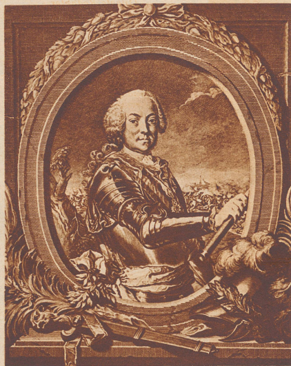
Der erste Träger des Maria-Theresia-Ordens, Graf Leopold Daun. Er bekam die Auszeichnung am 18. Juni 1757, am Tage der Schlacht bei Kolin.

Wie merkwürdig ist nun angesichts dieses Beispiels, daß das selbe Oesterreich, das mit dieser Unerbittlichkeit das Herkommen und die Ueberlieferung zu verteidigen wußte, die einzigartige Einrichtung des Maria-Theresia-Ordens besaß. Die Kaiserin Maria Theresia gründete den Orden, nachdem einer der jüngeren Offiziere ihrer Ar-mee einen Sieg «vorschriftswidrig» errungen hat. Weil er sich gegen die Disziplin verging, hätte er erschossen werden sollen. Weil er die Gesamtlage der kaiserlichen Armeen wesentlich verbessert hat, mußte er ausgezeichnet werden. Aus diesem Dilemma heraus entstand nun der Maria-Theresia-Orden, dessen Ritter nur solche An-gehörige der Armee sein können, die einen Sieg heim-bringen, indem sie sich gegen den höheren Befehl vergehen.