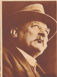
Christian Blaser, Schwarzenegg, Schwingerkönig 1898.