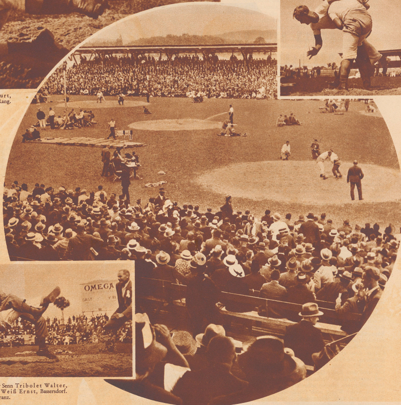
Blick auf den Festplatz im Berner Wankdorf-Stadion. 270 Mann, die Elite der Schweizer Turner- und Sennenschwinger, waren zu der Konkurrenz aufgetrieben. 25 000 Menschen nahmen an den Wettkämpfen als Zuschauer teil.