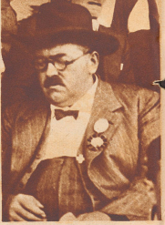
Hans Stucki, Konolthgen, Schwingerkönig 1900/1902/1905.