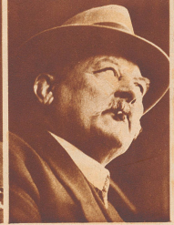
Christian Blaser, Schwarzenegg, Schwingerkönig 1898.