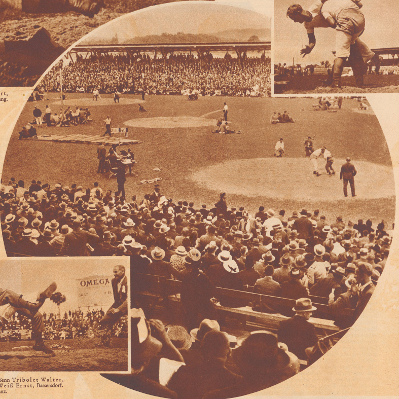
Blick auf den Festplatz im Berner Wankdorf-Stadion. 270 Mann, die Elite der Schweizer Turner- und Sennenschwinger, waren zu der Konkurrenz aufgeboten. 25 000 Menschen nahmen an den Wettkämpfen als Zuschauer teil.