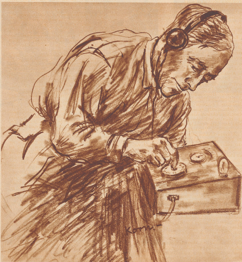
Das «Indianerohr» von heute. Das schärfste Indianerohr von einst wird um ein Vielfaches an Schärfe übertroffen. Der winzige Kasten übermitteln seinem Hörer die kleinsten Geräusche aus Orten von vielen tausend Kilometer Entfernung.