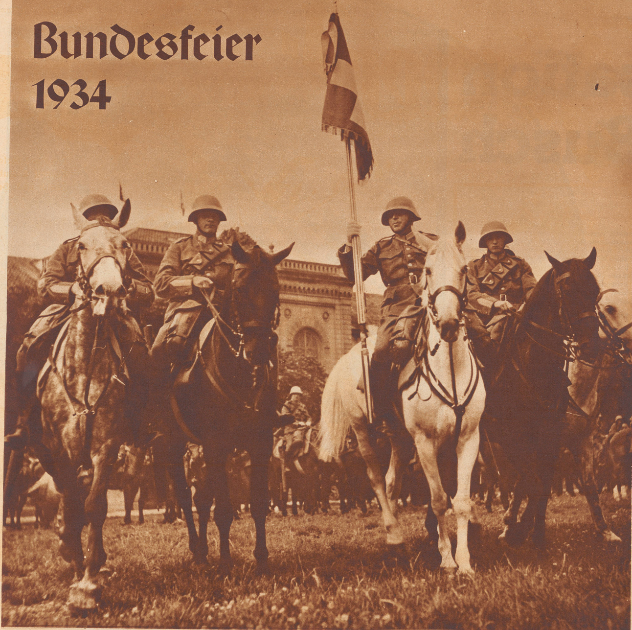
In Erinnerung an die vor zwanzig Jahren erfolgte Mobilmachung der gesamten Armee wurde überall im Schweizerland der diesjährige Nationalfeiertag in besonderer Weise begangen. In Zürich gipfelte die Feier in einem Zug des Militärs – Infanterie und Kavallerie – durch die Stadt und einer großen patriotischen Kundgebung auf dem alten Tonhalleareal. Bild: Die Uebergabe einer Kavallerie-Regimentsstandarte im Kasernenhof, auf dem selben Platz, wo 1914 die Truppen vereidigt wurden.