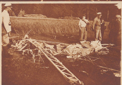
Ueberreste einer abgerissenen Tragfläche, die 1 km von der Unfallstelle entfernt aufgefunden wurden.