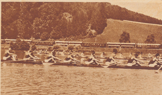
Die Regatta auf dem Rotsee. Im Hintergrund der Zuschauerzug mit den neuartigen Aussichtssommerwagen. Der Zug steht nicht still, sondern begleitet, am Ufer entlang fahrend, die einzelnen Rennen.