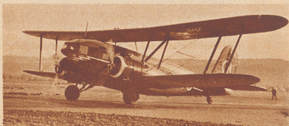
Die verunglückte Curtiss-Condor-Maschine. Sie war vor drei Monaten in Amerika angekauft worden und versah den Kursverkehr auf der Strecke Zürich-Berlin. Sie war das grösste Flugzeug, das die Schweiz besaß.

Auf der Fahrt von Zürich nach Berlin stürzte am 27. Juni bei Tuttlingen in Württemberg aus bis jetzt noch nicht geklärten Gründen das Großflugzeug «Condor» der Swissair aus 1500 m Höhe ab und wurde total zertrümmert. Die drei Leute der Besatzung und alle neun Passagiere kamen ums Leben. Die Katastrophe ist das größte Unglück, von dem der Schweizer Luftverkehr je betroffen wurde. Bild oben: Die Absturzstelle mit dem Trümmerhaufen in einem Buchenwald bei Tuttlingen. Ein unentwirrbares Chaos von Trümmern, aus dem die Toten bereits geborgen sind.