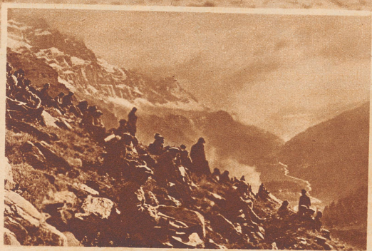
Zuschauer beim Klausenrennen auf der Paßhöhe. Blick auf den Urnerboden.

BULLUS (Deutschland) hält seit 1930 den Klausenrekord für Motorräder. Auf NSU 500 cm 3 brachte er mit einem Stundenmittel von 77,500 km die 21,500 km lange Prüfungsstrecke in 16:41,0 Minuten hinter sich.