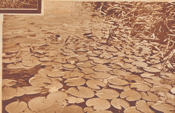
Ein dichtes Seerosenband säumt den See.

Bestätigungsstellen: 1a. Zollikofen, Gasthaus zum «Bahnhof»; oder 1b. Bärswil, Restaurant «Egli». 2. Moosseedorf, Restaurant «Seerose».