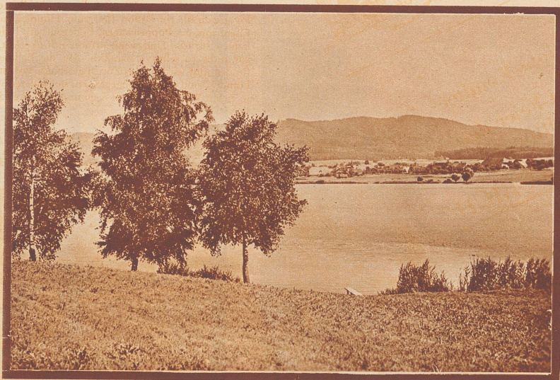
Der liebeliche Moosseedorfsee ist eines der schönsten Ausflugsziele in der Umgebung Berns. Im Hintergrund der Hügellzug des Grauholz.

Da der Wanderatlas «Bern Ost» nunmehr fertiggestellt ist, können wir unsern Wanderfreunden aus dem Bernbiet nun auch in ihrer engern Heimat schöne Spezialtouren mit Wanderprämien vorschlagen. (Näheres darüber, sowie weitere Touren siehe auf Seite 975). Als erste haben wir eine schattenreiche Hochsommerwanderung durch das Grauholz, mit schöner Badegelegenheit im lieblichen Moosseedorfsee gewählt.