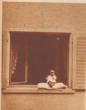
Mut-fer hält im Hintergrund