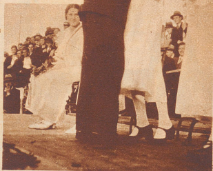
Mut und Anmut