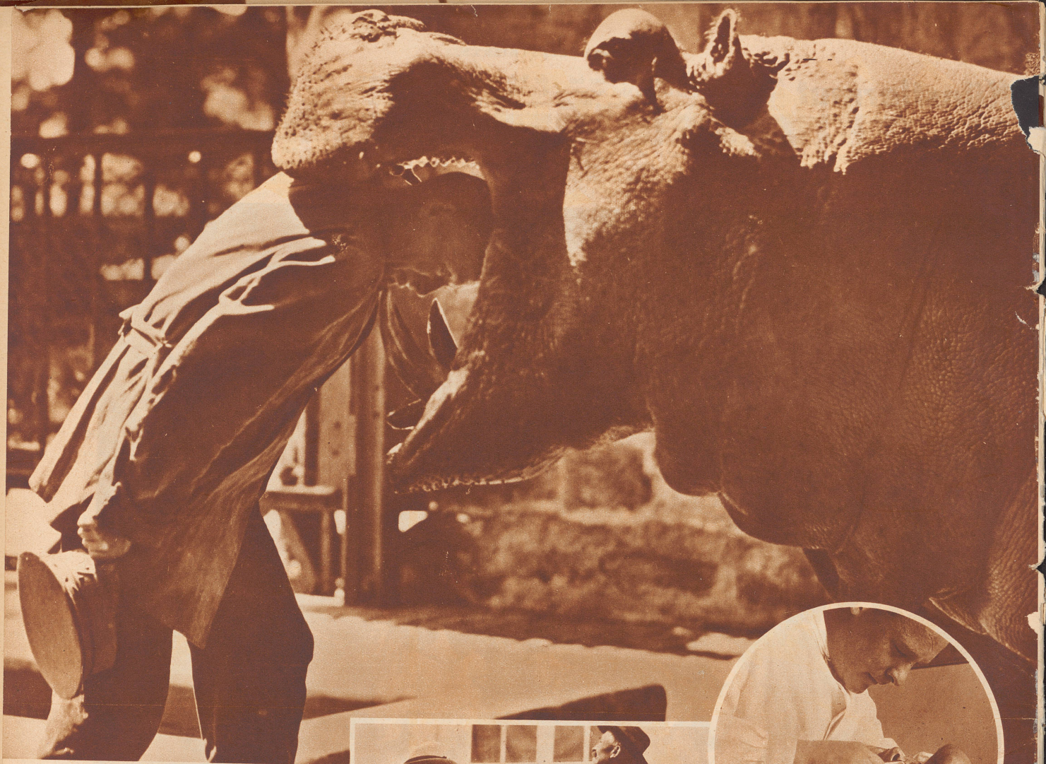
Der Maulheld . . .