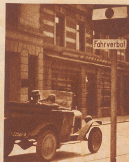
Mut zur Buße