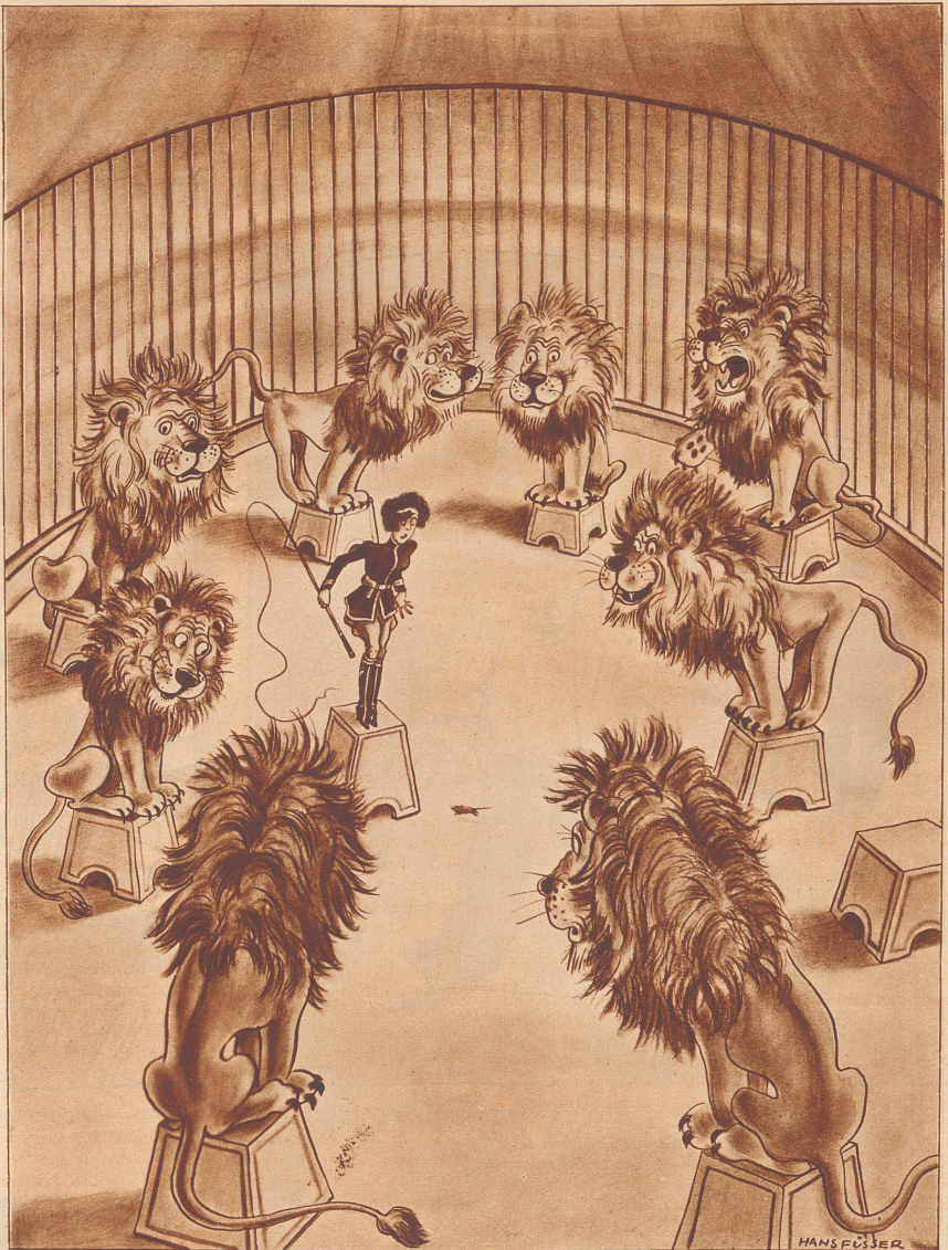
Die mutige Dompteuse erschrickt wegen einer Maus.

Zeichnung von H. Füssler (Bavaria-Verlag)