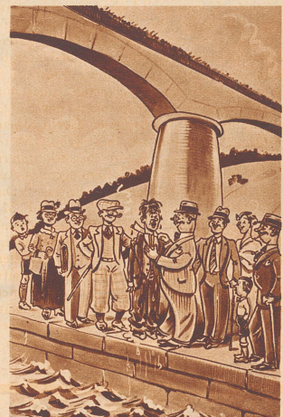
«Das war sehr mutig von Ihnen, junger Mann, daß Sie ohne Besinnen von solcher Höhe ins Wasser sprangen, um die Ertrinkende zu retten». «Jg. ja, alles gut und schön, aber wenn ich nur wüßte, wer mich eigentlich hineingestoßen hat».