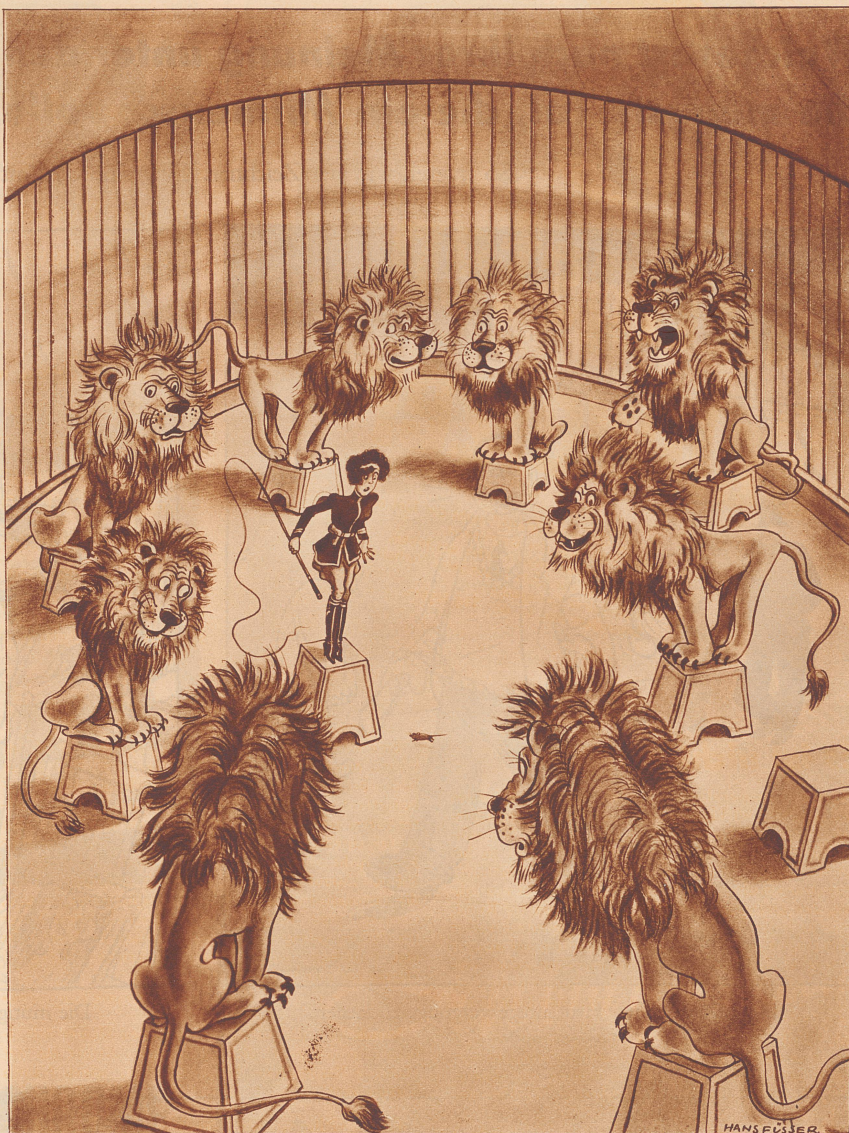
Die mutige Dompteuse erschrickt wegen einer Maus.

«Fasse Mut, Edgar, jetzt kannst du Vater am besten fragen, er hat schon die Schuhe ausgezogen!»