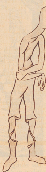
... und der Mut allein.