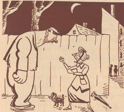
Die mutigen Frauen in Amerika.

Die amerikanische Polizei hat dem Publikum den Rat gegeben, sich gegen die Banditen selbst zu wehren und bei Überfällen mutig zuzuschlagen.