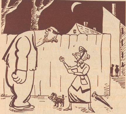
Die mutigen Frauen in Amerika.

Die amerikanische Polizei hat dem Publikum den Rat gegeben, sich gegen die Banditen selbst zu wehren und bei Überfällen mutig zuzuschlagen.