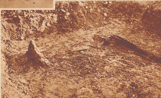
Das freigelegte Wagengrab, in dem deutliche Radspuren zu sehen sind.

Wir verdanken fast ausschließlich unser Wissen aus der Vor- und Frühgeschichte unseres Landes den Forschungen aus Funden und Ausgrabungen. Viele Flachlandseen unserer Heimat waren in der älteren und jüngeren Steinzeit und später von Pfahlbauern bevölkert, die ihre primitiven Hütten über dem Wasserspiegel bauten. Die wenigsten von uns haben aber je etwas von der Hallstattzeit und den Hügelgräbermenschen gehört. Die Hallstattzeit ist die ältere Periode der Eisenzeit. Sie verdankt ihren Namen den berühmten und charakteristischen Gräberfunden bei Hallstatt in Oesterreich und wird deshalb Hallstattzeit oder Hallstattperiode genannt. Sie erstreckt sich ungefähr vom Jahre 1000 bis zum Jahre 400 vor Christus. Von den Hallstattmenschen wissen wir, daß sie hordenweise die Pfahlbauten verlassen haben