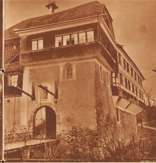
Das um 1230 erbaute Schloß Hagenwil wird noch heute von einem wassergefüllten Graben umspült. Seit 1806 ist es im Besitze der Familie Angehrn, aus der Abt Beda von St. Gallen stammt, der zweitbeste Abt, der aus der Freiheitsbewegung des Jahres 1795 bekannt ist.

Bischofszell , 473/510 m. Kleines, altes Städtchen am Hang über dem Zusammenfluß von Thur und Sitter. Mit Sittertal 2860 zu 2/3 reformierte Einwohner. Viel Industrie: Karton- und Papierfabrik. Mehrere Mühlen an der Sitter; die Sittermühle, die Bruggmühle und seit 1927 die Credimühle; jenseits der Sitter im Nordteil Konservenfabrik seit 1910, mit 90-150 Arbeitern (Konserven, Kondensmilch, Schachtelkäse und als Spezialität Pomol), große Molerie-, Gas-, Wasser- und Elektrizitätswerk, ferner Strumpfwarenfabrik, Strickfabriken, Thermolith A.-G. (elektr. Heiz- und Kochapparate), Saurostoffwerk, Wolfram- und Molybdän A.-G. (Bleuchungsmittel), Buchdruckerei, edlg. Fischbrüchensalze an der Thur, Käseerei. Seit 1876 Station der SBB der Linie Goßau-Sulgen; zweite Station Nord auf der Nordseite der Sitter für die Fabriken im Sittertal. Autobuslinien nach Amriswil, Wil und Uzwil.