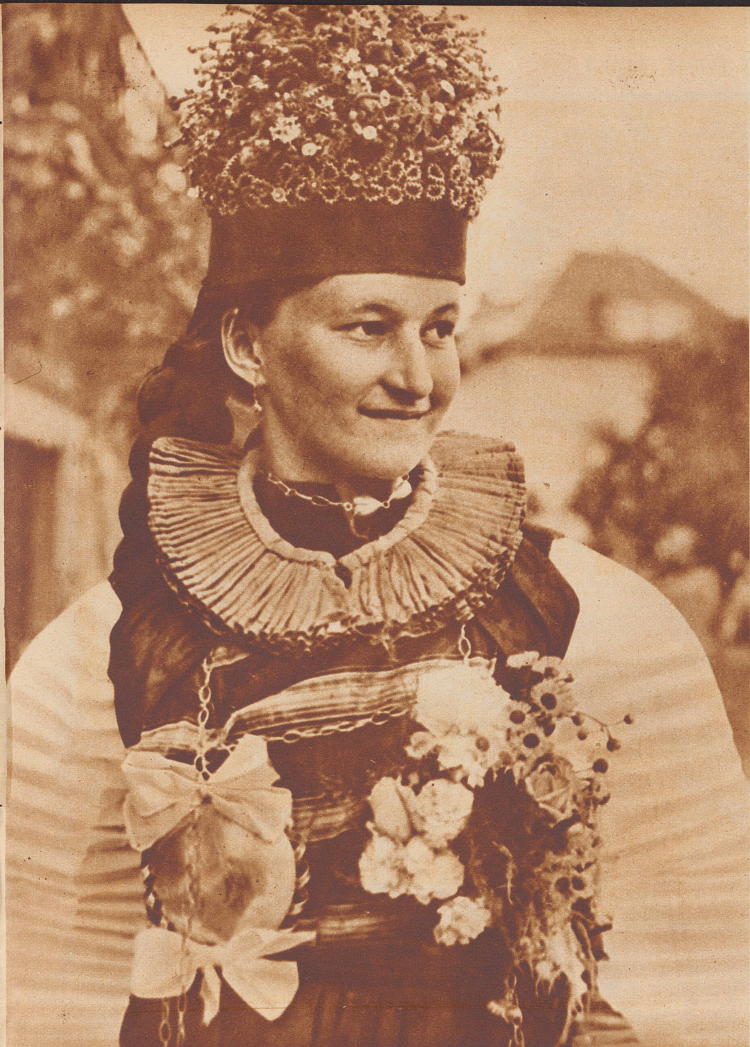
Junge Düdingerinnen in der Tracht des freiburgischen Sensebezirkes.