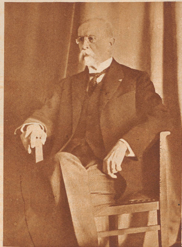
T. G. Masaryk, eine der jüngsten Aufnahmen.

Nun mußte er wieder einmal nach Wien übersiedeln. Mit Unterstützung befreundeter Kreise konnte er dort seine Studien fortsetzen, und zwei Jahre, nachdem er die Schmiedelaufbahn aufgegeben hatte, legte Thomas Masaryk als Siebzehnjähriger die Reifeprüfung des Gymnasiums mit der höchsten Auszeichnung ab.