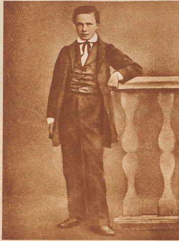
Masaryk als Gymnasiast.

In seinem ersten Brünner Jahre schloß er sich der freidenkerischen Bewegung, die unter den Brünner Studenten damals stark verbreitet war, an. Er verwickelte sich, ohne Rücksicht auf seine Interessen, in freidenkerische Ausschreitungen, wurde von der Polizei gestellt und mußte das Brünner Gymnasium verlassen.