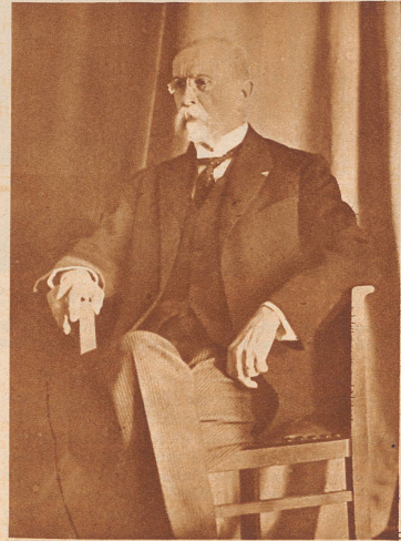
T. G. Masaryk, eine der jüngsten Aufnahmen.

Nun mußte er wieder einmal nach Wien übersiedeln. Mit Unterstützung befreundeter Kreise konnte er dort seine Studien fortsetzen, und zwei Jahre, nachdem er die Schmiedelaufbahn aufgegeben hatte, legte Thomas Masaryk als Siebzehnjähriger die Reifeprüfung des Gymnasiums mit der höchsten Auszeichnung ab.