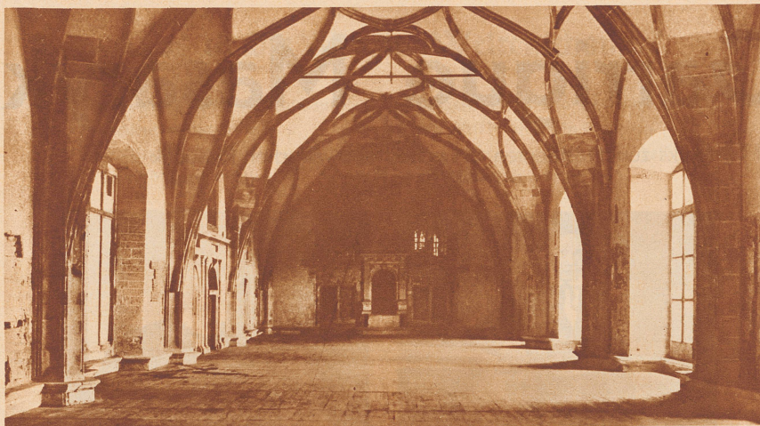
Der Wladislaw'sche Saal in der Prager Burg.

In diesem Thron- und Krönungssaal der böhmischen Könige wurde Masaryk für die dritte Präsidentschaftsperiode gewählt, während bisher die Zeremonie der Wahl und der Eidesleistung unter den einfachsten Formen im Parlamentsgebäude stattfand.