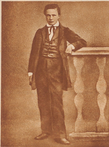
Masaryk als Gymnasiast.

In seinem ersten Brünner Jahre schloß er sich der freidenkerischen Bewegung, die unter den Brünner Studenten damals stark verbreitet war, an. Er verwickelte sich, ohne Rücksicht auf seine Interessen, in freidenkerische Ausschreitungen, wurde von der Polizei gestellt und mußte das Brünner Gymnasium verlassen.