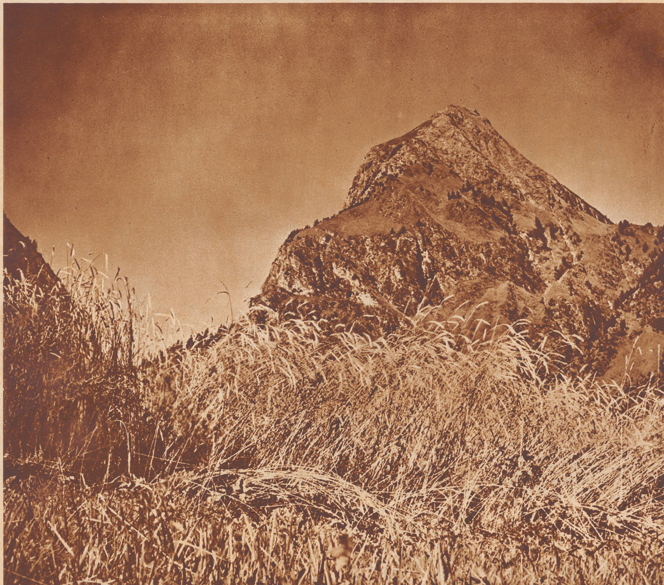
Aquarossa , das einzige Bad in der Südschweiz, ist von der Station Biasca aus oder mit dem Postauto über den Lukmanier zu erreichen. Das Dorf Aquarossa mit 37 Einwohnern ist von hohen Bergen umsäumt und liegt in der Nähe ausgedehnter Nadelwälder. Eine arsenhaltige Quelle wird zu Trink- und Badekuren gegen Gelenkrheumatismus, Gicht-, Blut- und Hautkrankheiten angewandt. Der Schlamm, den die Quelle absetzt, wird zu Packungen gegen Ischias gebraucht.