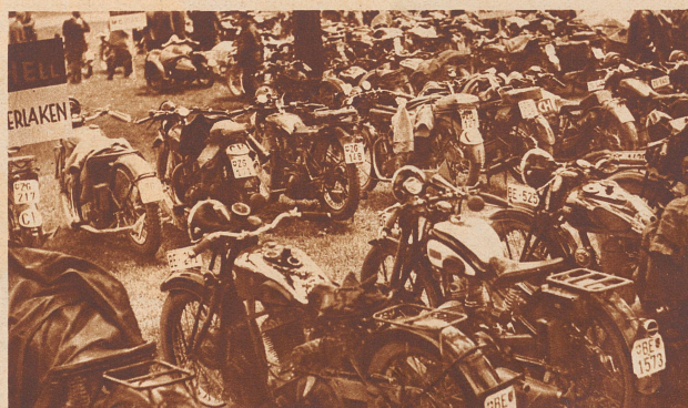
Kleine U. M. S.-Sternfahrt. Rund 600 Fahrzeuge von 32 Sektionen aus der deutschen Schweiz beteiligten sich an der Sternfahrt der U. M. S. am Auffahrtstage, bei welcher der Moto-Sport-Club Bern mit 2420 Punkten als Sieger hervorging. Bild: Blick auf den Parkplatz der Maschinen am Ziel der Fahrt: Albisgütli bei Zürich.