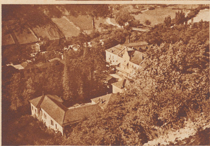
Die Kuranstalten von Lavey-les-Bains.