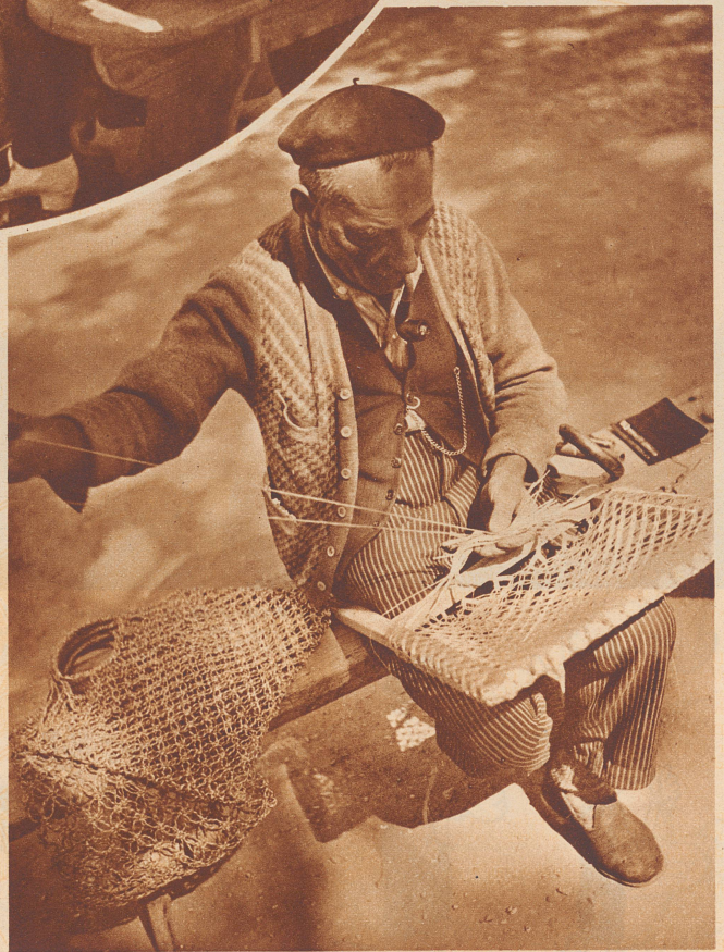
Ihm ist die Zeit bis zur Heilung lang geworden. Er will seine Tage nicht müßig verbringen und hat sich eine nützliche Arbeit zugelegt.