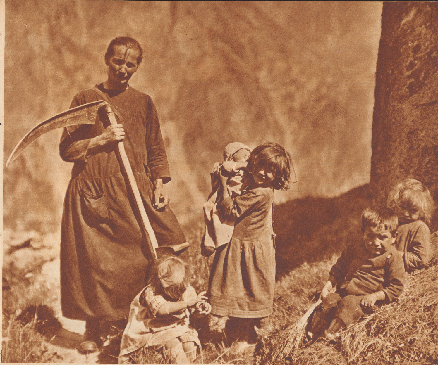
Wenn der Walliser Bergbauer im Tale Arbeit und Verdienst sucht, dann lastet die ganze Arbeit zu Hause auf der Frau. Arbeit im Hause, im Stall und auf dem Feld. Die Kinder müssen alle mit. Sie sitzen am Wegrand und spielen mit Steinen; kein buntbemaltes, blechernes Spielzeug billiger Machart und mit großem Reklamelärm auf den Markt geworfen, kommt in ihre Hände. Die Blumen am Weg entzünden die kindlichen Phantasien, aus Holzstücken entstehen die erstaunlichsten Gebilde. Das lebendige Wasser rauscht an ihnen vorüber. Die Mutter hat wenig Zeit, und das kleine Mädchen, das noch kaum zur Schule geht, hat schon seine Pflicht und Aufgabe, den Säugling zu warten. Noch kein erwachsener Mensch, noch nicht zum Leben richtig erwacht und schon ein wenig Mutter.