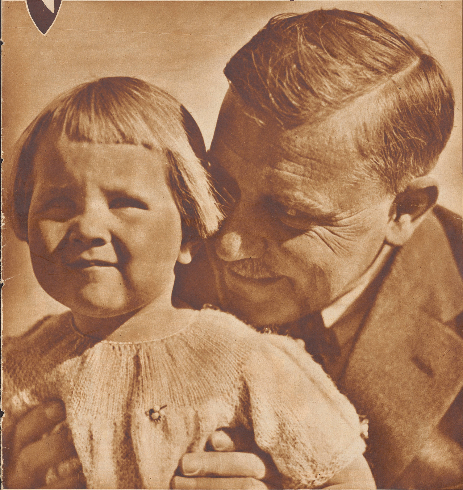
Othmar Schoeck mit seinem Töchterchen Gisela.