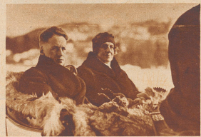
Gustav Fröhlich der beliebte Filmstar, verbrachte seine Ferien in St. Moritz.

Kleine Revue berühmter ausländischer Gäste der Winter- Saison 1933/34 auf Schweizer Kur- und Sportplätzen