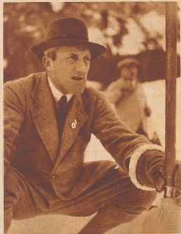
Sir Percy Bates

der englische Flieger und Besieger des Mount Everest im Flugzeug, in Begleitung seiner Mutter bei einer Ausfahrt in Arosa.