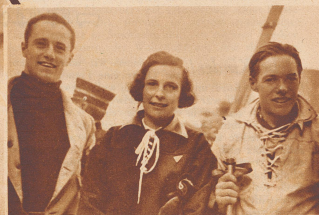
Leni Riefenstahl ebenso bekannt als charmante Filmschauspielerin wie als ausgezeichnete Skiläuferin, trieb Wintersport in Davos.

Kleine Revue berühmter ausländischer Gäste der Winter- Saison 1933/34 auf Schweizer Kur- und Sportplätzen