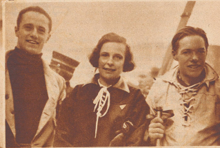
Leni Riefenstahl ebenso bekannt als charmante Filmschauspielerin wie als ausgezeichnete Skiläuferin, trieb Wintersport in Davos.

Kleine Revue berühmter ausländischer Gäste der Winter- Saison 1933/34 auf Schweizer Kur- und Sportplätzen