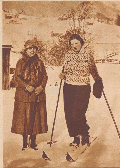
Die Königin der Niederlande und die Kronprinzessin Juliana

der bekannte deutsche Luftschiffer und Führer des «Graf Zeppelin» ist seit einigen Jahren ein ständiger Feriengast in Davos.