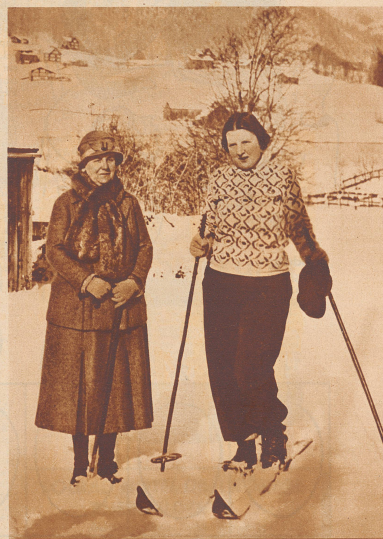
Die Königin der Niederlande und die Kronprinzessin Juliana

der bekannte deutsche Luftschiffer und Führer des «Graf Zeppelin», ist seit einigen Jahren ein ständiger Feriengast in Davos.