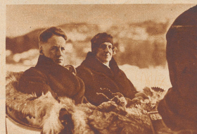
Gustav Fröhlich der beliebte Filmstar, verbrachte seine Ferien in St. Moritz.

Kleine Revue berühmter ausländischer Gäste der Winter- Saison 1933/34 auf Schweizer Kur- und Sportplätzen