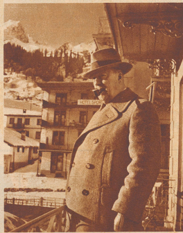
Dr. Hugo Eckener