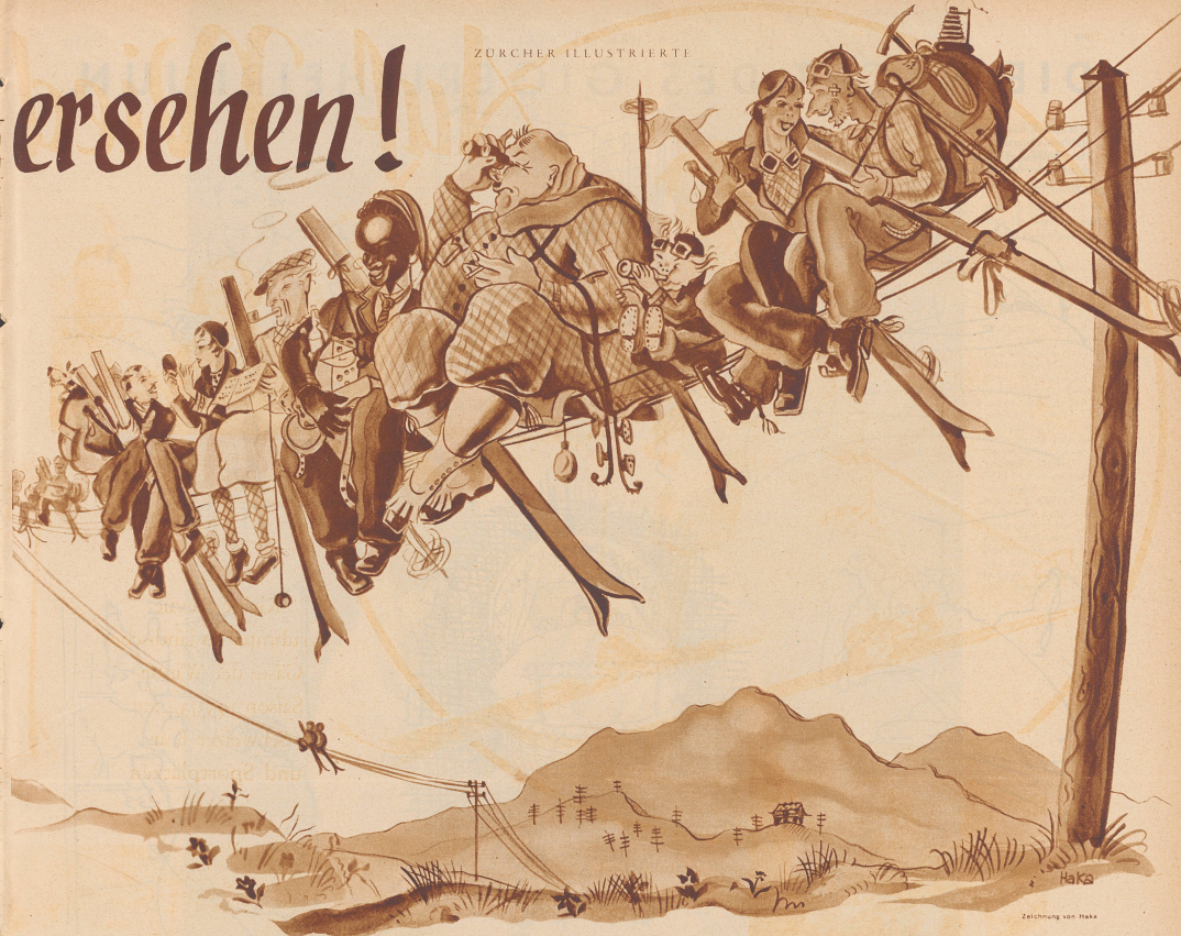
Die Zugvögel sammeln sich zur Abreise.

wählten für ihren diesjährigen Wintersport-Aufenthalt das idyllische Dörfchen Unterwasser im Toggenburg.