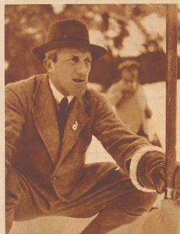
Sir Percy Bates

der englische Flieger und Besitzer des Mount Everest im Flugzeug, in Begleitung seiner Mutter bei einer Ausfahrt in Arosa.