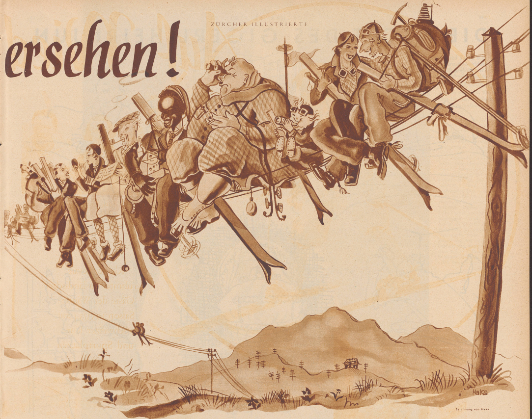
Die Zugvögel sammeln sich zur Abreise.

wählten für ihren diesjährigen Wintersport-Aufenthalt das idyllische Dörfchen Unterwasser im Toggenburg.