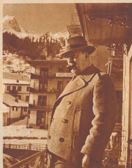
Dr. Hugo Eckener