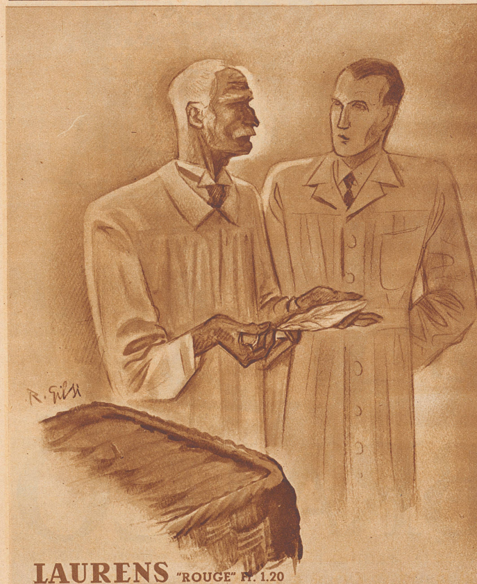
LAURENS "ROUGE" N. 120

«Nachher kamen die anderen Blumen an die Reihe. Ich hab hübsche Sträuße gebunden... schlug sie in Seidenpapier und trug sie von Zimmer zu Zimmer. Heimlich... es hat mich kein Mensch dabei gesehen. Später