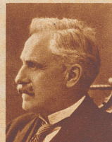
Bundesrichter Dr. V. Merz

Die Schweizerische Luftverkehrs-Gesellschaft hat in Amerika ein neues Express-Grossverkehrsflugzeug erworben, das in diesen Tagen aus Cherbourg in Dübendorf eingetroffen ist und am 1. Mai auf der Linie Zürich-Wien in Dienst gestellt wird. Die Maschine, die das allmodernste Verkehrs-Luftfahrzeug darstellt, bietet Platz für zehn Passagiere und zwei Piloten, besitzt einziehbares Fahrgestell und wird angetrieben von einem 720 PS-Wright-Cyclone-Motor, der eine maximale Geschwindigkeit von 320 und eine durchschnittliche Reisegeschwindigkeit von 260 Kilometer gestattet. Die Reise von Paris nach Dübendorf wurde in knapp zwei Stunden zurückgelegt.