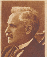
Bundesrichter Dr. V. Merz

Die Schweizerische Luftverkehrs-Gesellschaft hat in Amerika ein neues Express-Großverkehrsflugzeug erworben, das in diesen Tagen aus Cherbourg in Dübendorf eingetroffen ist und am 1. Mai auf der Linie Zürich-Wien in Dienst gestellt wird. Die Maschine, die das allmodernste Verkehrs-Luftfahrzeug darstellt, bietet Platz für zehn Passagiere und zwei Piloten, besitzt einziehbares Fahrgestell und wird angetrieben von einem 720 PS-Wright-Cyclone-Motor, der eine maximale Geschwindigkeit von 320 und eine durchschnittliche Reisegeschwindigkeit von 260 Kilometer gestattet. Die Reise von Paris nach Dübendorf wurde in knapp zwei Stunden zurückgelegt.