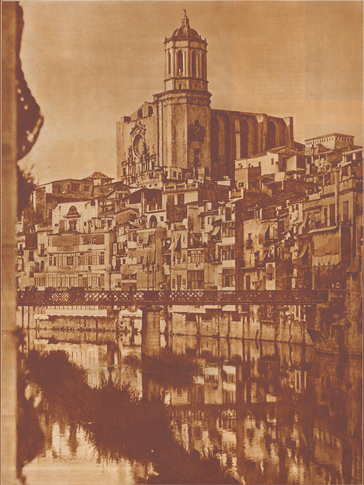
Die Stadt Gerona in Spanien