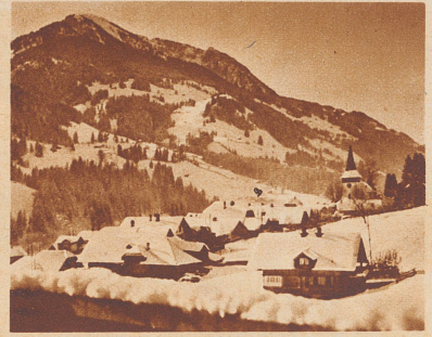
Ein kurzweiliges Krankenhaus hat das Dorf Erlenbach im Berner Simmental. Eine Menge zutraulicher Vögel kommt hier fast jeden Tag auf Krankenvisite.