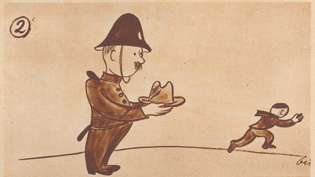
« . . . . Da bringe ich halt den Hut nach dem Posten.»