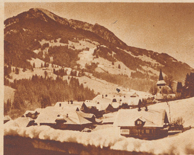
Ein kurzweiliges Krankenhaus hat das Dorf Erlenbach im Berner Simmental. Eine Menge zutraulicher Vögel kommt hier fast jeden Tag auf Krankenvisite.