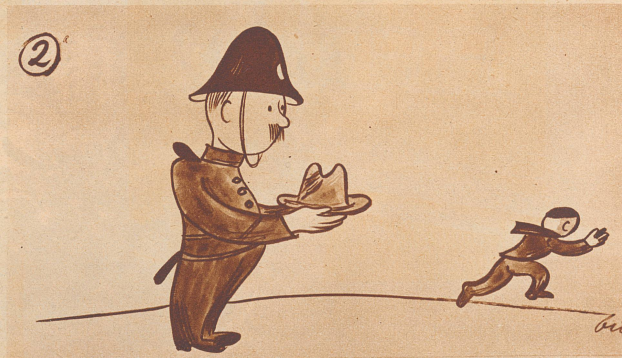
« . . . . Da bringe ich halt den Hut nach dem Posten.»