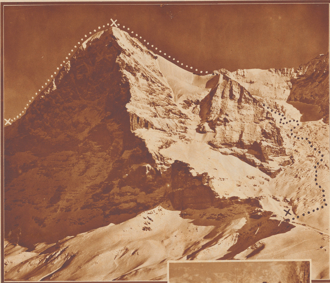
Die Aufstiegsroute über den Ostgrat und der Abstieg über den Eigergletscher zur Station Eigergletscher.