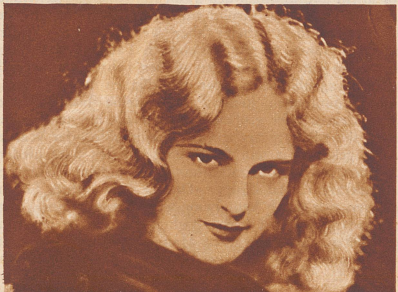
CAMILLA HORN sagt: „Meine vielen Filmfreunde und ich benutzen stets Nurlond und sind entzückt.“