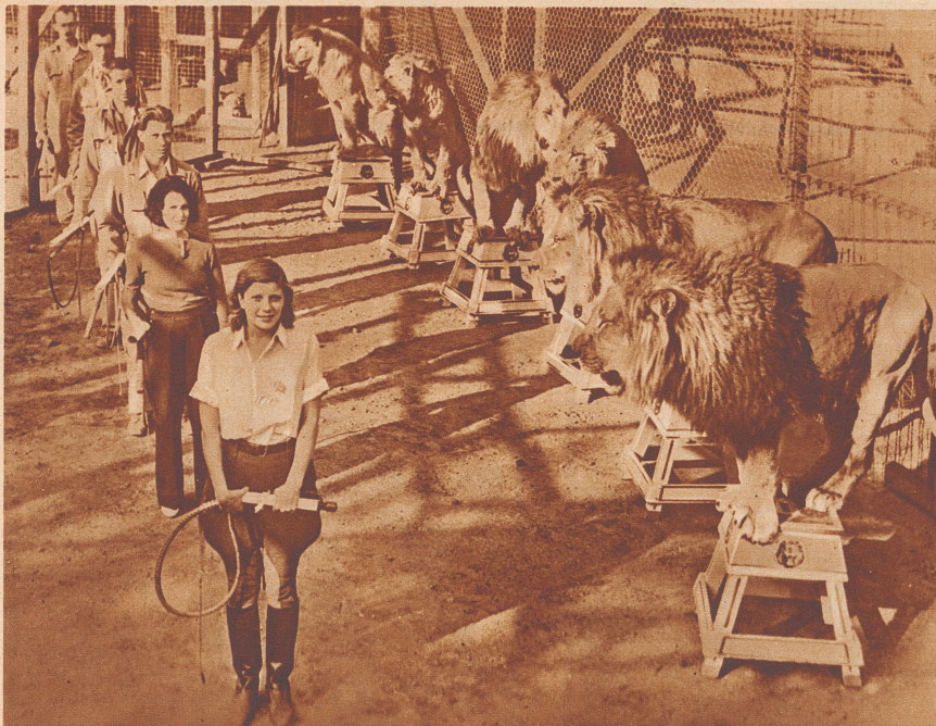
Examen im «Klassenzimmer» für Löwenbändiger.