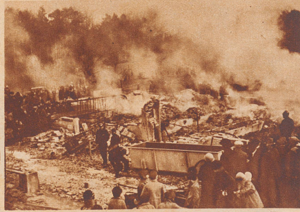
15 Stück Vieh, 900 Kubikmeter Heu. In der Nacht vom letzten Samstag zum Sonntag brannte das Oekonomiegebäude des «Bruderholzhofes» in Oberwil bei Basel bis auf den Grund nieder. 15 Stück Großvieh, alle Futtermittel und zahlreiche landwirtschaftliche Maschinen verbrannten. Der Schaden beträgt 100 000 Franken.