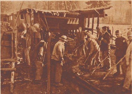
4000 Hühner. In der Nacht vom 8. zum 9. Januar brannte in Hasle-Rüegsau eine Hühnerfarm teilweise nieder. Die Farm beherbergte 8000 Hühner. 4000 schlachtreife Tiere kamen in den Flammen um.