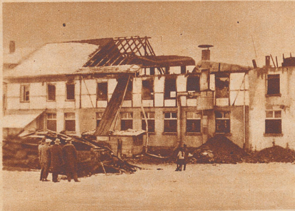
70 Zimmerausstattungen. Am 12. Januar wurde die Möbelfabrik Bieri in Rubigen bei Bern durch einen Brand fast vollständig zerstört. 70 fertige Wohn- und Schlafzimmersausstattungen gingen in Rauch auf. Der Schaden übersteigt 100 000 Franken.