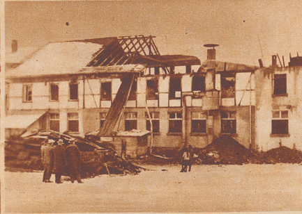
70 Zimmerausstattungen. Am 12. Januar wurde die Möbelfabrik Bieri in Rubigen bei Bern durch einen Brand fast vollständig zerstört. 70 fertige Wohn- und Schlafzimmersausstattungen gingen in Rauch auf. Der Schaden übersteigt 100 000 Franken.