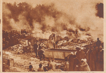
15 Stück Vieh, 900 Kubikmeter Heu. In der Nacht vom letzten Samstag zum Sonntag brannte das Oekonomiegebäude des «Bruderholzhofes» in Oberwil bei Basel bis auf den Grund nieder. 15 Stück Großvieh, alle Futtermittel und zahlreiche landwirtschaftliche Maschinen verbrannten. Der Schaden beträgt 100 000 Franken.