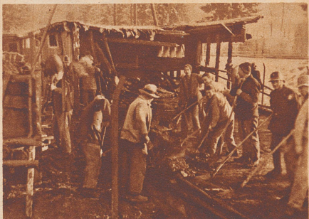
4000 Hühner. In der Nacht vom 8. zum 9. Januar brannte in Hasle-Rüegsau eine Hühnerfarm teilweise nieder. Die Farm beherbergte 8000 Hühner. 4000 schlachtreife Tiere kamen in den Flammen um.