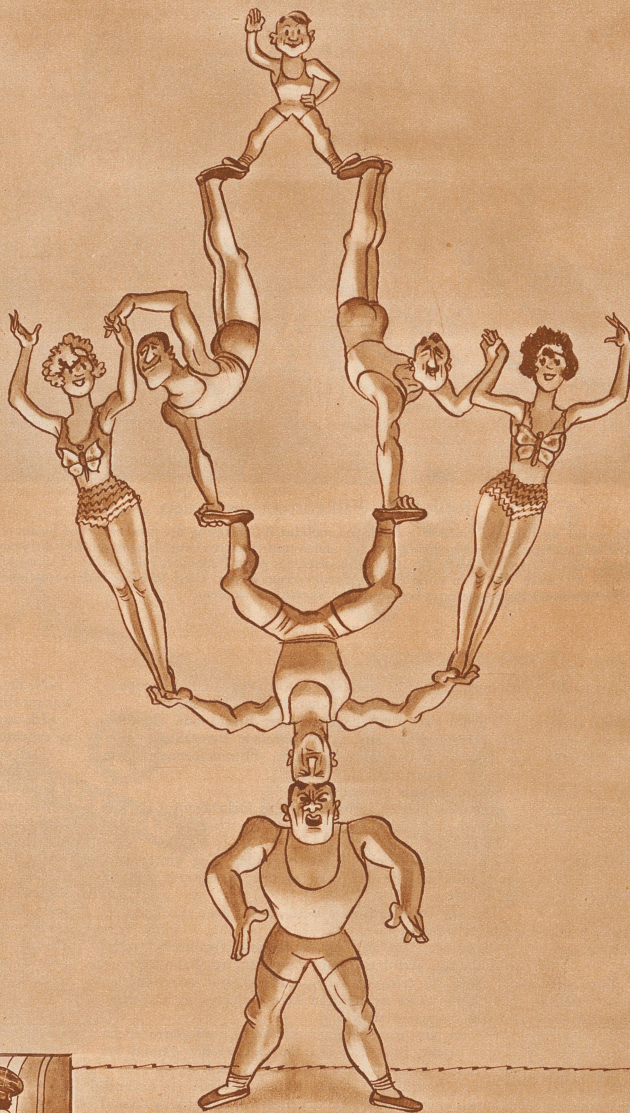
Die Akrobatenfamilie. «Kinder beeilt euch, ich muß mal nießen!»