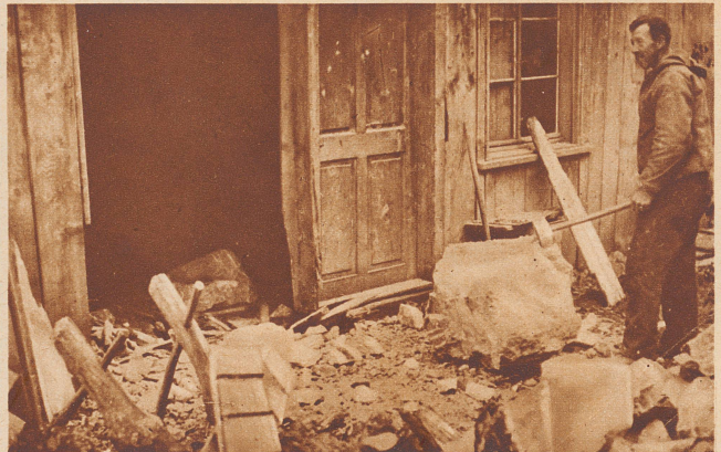
Das von den abstürzenden Felsen getroffene und arg beschädigte Posthaus von Betlis.