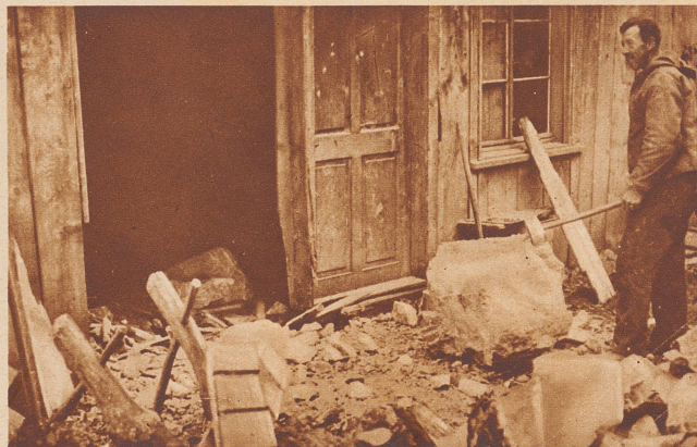
Das von den abstürzenden Felsen getroffene und arg beschädigte Posthaus von Betlis.