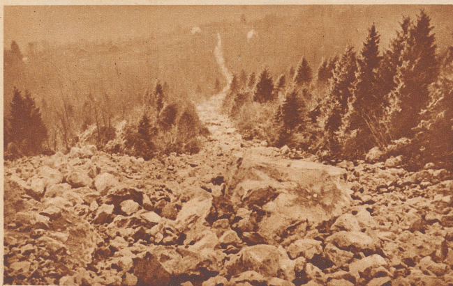
Der Weg, den die Felsmassen von der Abbruchstelle gegen den Walensee hinunter genommen haben.