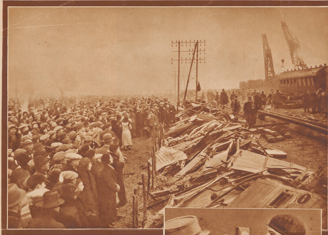
Blick auf den Schauplatz der Katastrophe am Morgen nach dem Zusammenstoß. Eine riesige Menschenmenge besuchte die Unglücksstätte. Die Wagenruinen sind bereits von den Geleisen weggeräumt. Mit mächtigen Kranen werden die entgleisten, noch intakten Wagen in die Geleise gehoben.