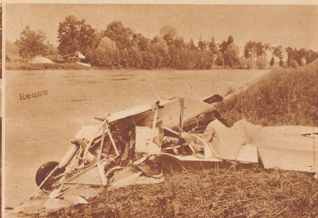
16. Juni. An diesem Tage unternahm der Sportflieger G. Page aus Chaux einen Trainingsflug zur bevorstehenden Jungfraustrafette. Zwischen Drälikon und Hünenberg im Freiamt streifte die Maschine die Blitzschutzleitung einer Starkstromleitung, stürzte in die Reuss ab und wurde total zertrümmert. Der Motor sank, Rumpf und Tragflächen trieben flußabwärts und blieben an einem Pfeiler der Sauerbrücke hängen. Die beiden Insassen konnten sich durch Schwimmen retten, sie trugen nur leichte Gesichtsverletzungen davon. Bild: Die Ueberreste des Sportflugzeuges CH 330 nach der Bergung aus der Reuss.