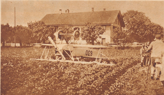
6. Juli. Ein vom Waffenplatz Thun aufgestiegenes, von einem westschweizerischen Leutnant gesteuertes Beobachterflugzeug mußte in der Nähe des Strandbades Dürrenast notlanden. Die Maschine sauste mit großer Geschwindigkeit in einen Karstofflacker hinein, überschlug sich, blieb auf dem Rücken liegen und wurde stark beschädigt. Der Pilot kam nicht zu Schaden.