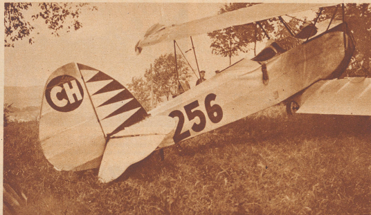
12. Juni. Das schweizerische Sportflugzeug CH 256, das sich mit zwei Insassen auf dem Flug von Berlin nach Konstanz befand, mußte wegen Brennstoffmangel in der Nähe von Ravensburg notlanden. Nach Uebernahme von neuem Betriebsstoff startete die Maschine wieder, aber nach ungefähr 150 m versagte plötzlich der Motor. Das Flugzeug mußte niedergehen, streifte zuerst eine Telefonleitung und blieb in einer Baumgruppe stecken. Propeller, Motor und Tragflächen wurden arg beschädigt. Der Pilot blieb unverletzt.