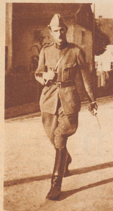
Mitrailleur - Hauptmann Pilet während der Grenzbesetzung in einem Berner Juradorf.

bis 1928 gehörte er dem waadtländischen Grossen Rat an, und 1925–1928 vertrat er die freisinnige Partei im Nationalrat. In der Armee begann er seine Laufbahn, kaum 19jährig, mit dem Leutnantsbrevet der Infanterie. Später wechselte er zu den fahrenden Mitrailleurs hinüber, wurde 1917 Hauptmann, 1924 Major und Kommandant des Fusilierbataillons 1. 1928 avancierte er zum Oberstleutnant. Am 13. Dezember 1928 wählte ihn die Bundesversammlung an Stelle des zurückgetretenen Dr. Chuard als zehnten Waadtländer seit 1848 zum Bundesrat. In der Exekutive stand er zuerst ein Jahr dem Departement des Innern vor. Seit 1929 verwaltet er mit grosser Umsicht und bemerkenswerten Erfolgen das Post- und Eisenbahndepartement.