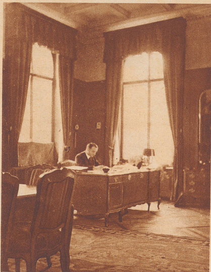
Das Arbeitszimmer Bundesrat Pilets. Der Chef des eidgenössischen Post- und Eisenbahndepartements hat sein Büro nicht im Bundeshaus, sondern im Gebäude der Nationalbank.