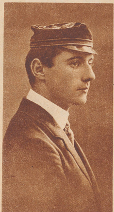
Marcel Pilet als 19jähriger Student der Universität Lausanne. Er gehörte der Studentenverbindung «Belles Lettres» an, die er zwei Jahre präsidierte.