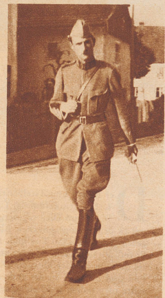
Mitrailleur - Hauptmann Pilet während der Grenzbesetzung in einem Berner Juradorf.

bis 1928 gehörte er dem waadtländischen Großen Rat an, und 1925–1928 vertrat er die freisinnige Partei im Nationalrat. In der Armee begann er seine Laufbahn, kaum 19jährig, mit dem Leutnantsbrevet der Infanterie. Später wechselte er zu den fahrenden Mitrailleurs hinüber, wurde 1917 Hauptmann, 1924 Major und Kommandant des Füsilierbataillons 1. 1928 avancierte er zum Oberstleutnant. Am 13. Dezember 1928 wählte ihn die Bundesversammlung an Stelle des zurückgetretenen Dr. Chuard als zehnten Waadtländer seit 1848 zum Bundesrat. In der Exekutive stand er zuerst ein Jahr dem Departement des Innern vor. Seit 1929 verwaltet er mit großer Umsicht und bemerkenswerten Erfolgen das Post- und Eisenbahndepartement.