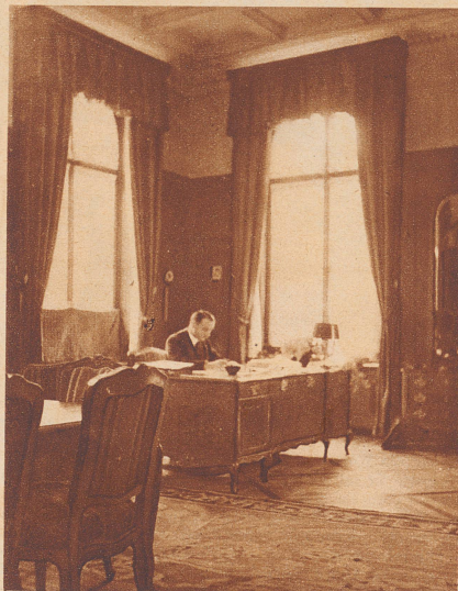
Das Arbeitszimmer Bundesrat Pilets. Der Chef des eidgenössischen Post- und Eisenbahndepartements hat sein Büro nicht im Bundeshaus, sondern im Gebäude der Nationalbank.