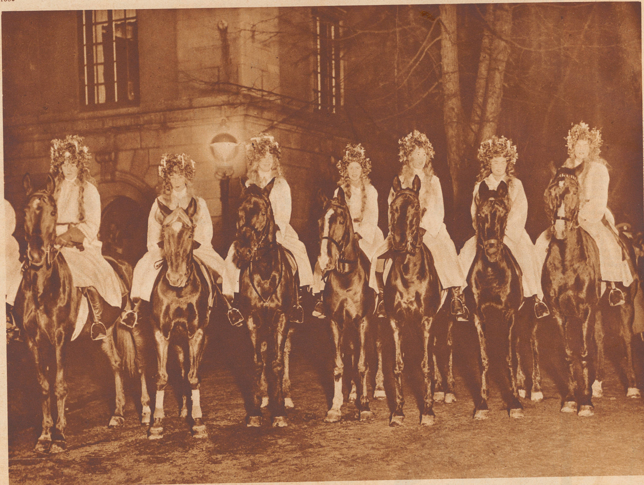
Das Luziafest in Stockholm. Alljährlich am 13. Dezember, der als der kürzeste Tag in Schweden gilt, wird in Stockholm das Luziafest gefeiert. Am Abend dieses Tages bewegt sich ein festlicher Umzug durch die Straßen der Stadt, an der Spitze die «Luziabraut» mit der Lichterkrone im Haar, die als Symbol des wiederkehrenden Lichtes angesehen wird. Unser Bild: Berittene Jungfrauen aus dem Gefolge der Luziabraut.