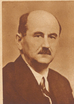
Johannes Huber Rechtsanwalt in St. Gallen Präsident des Nationalrates