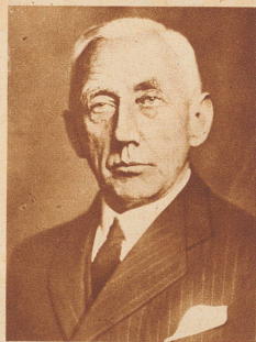
Roald Amundsen, der Entdecker des Südpols und große Arktisforscher, fand den Tod beim Absturz des Flugzeuges «Latham», mit dem er und der französische Flieger Guillebeaux eine Suchexpedition nach dem verschollenen italienischen Flieger Nobile in den Weg geleitet hatte.