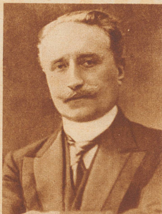
Paul Deschanel , Präsident von Frankreich, stürzte aus einem fahrenden Schnellzug. Bis heute sind die näheren Begleitumstände dieses Unfalls nicht restlos geklärt. Jedenfalls ist Deschanel nach der verhängnisvollen Nacht schwer geschädigt ins Elysée zurückgekehrt und starb bald an den Folgen des geheimnisvollen Eisenbahnunfalls.