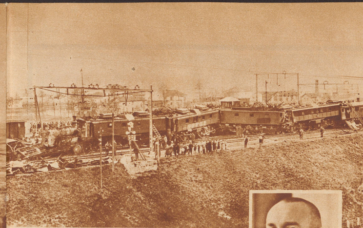
Die Eisenbahnkatastrophe von Bellinzona. Dieser Zusammenstoß von zwei Schnellzügen in der Nacht vom 23. zum 24. April 1924 war einer der schlimmsten Unglücksfälle, die auf dem Gebiet der Schweizerbahnen sich ereignet haben. Bei der Katastrophe fanden 6 Eisenbahner und 7 Passagiere den Tod, unter den letzteren der deutsche Wirtschaftsführer und Minister Karl Helfferich, der sich auf der Rückreise von Italien nach Deutschland befand. Rechts: Reichsminister Dr. Karl Helfferich.