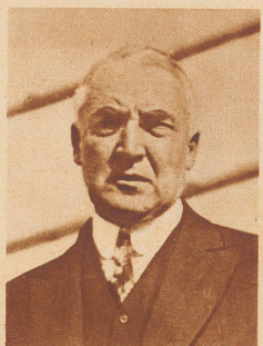
Warren G. Harding , der Nachfolger Wilsons in der Präsidentschaft Nordamerikas, starb auf einer Reise nach Alaska im August 1922 an den Folgen einer Fischvergiftung. Das war die offizielle Meldung, die durch die Presse ging. Später sind um diesen Todesfall eine Unmenge Gerüchte in Umlauf gebracht worden. In einem Buche, das in U.S.A. eine ungeheure Auflage erlebte, wurde sogar behauptet, seine Gattin hätte ihn vergiftet, um seine Ehre zu retten. Denn in der Tat war zu jener Zeit ein Riesenkorrupsionsskandal am Ausbrechen, in welcher Affäre Harding arg kompromittiert wurde.