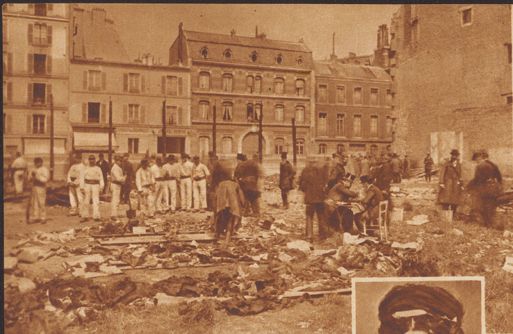
Der Brand des Wohltätigkeitsbasars in der Pariser Rue Jean Goujon. Am 4. Mai 1897 ereignete sich in der französischen Hauptstadt eine Feuersbrunst von ganz ungewöhnlichen Ausmaßen und Folgen. Infolge Explosion einer Projektionslampe geriet der Basar, den die verschiedenen Wohltätigkeitsvereine jedes Jahr veranstalteten, in Brand. Die Katastrophe forderte 124 Todesopfer, unter ihnen die Herzogin von Alençon. Ihre Leiche konnte nach dem Brande nicht aufgefunden werden. Nur ihren Trauring mit der Inschrift «Duchesse d'Alençon, Princesse de Bavière», fand man in einer Ecke der völlig verkohlten Halle. Unser Bild zeigt die Polizeibeamten bei der Durchsuchung der Brandstätte nach Gegenständen, die zur Identifizierung der Opfer nützlich sein könnten. Rechts: Die Herzogin von Alençon , geborne Prinzessin Sophie von Bayern. Sie war die Schwester der Kaiserin Elisabeth von Oesterreich, die in Genf vom Anarchisten Lucheni ermordet wurde.