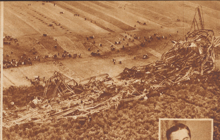
Die größte Luftschiffkatastrophe der Geschichte. Auf der Fahrt von England nach Indien stürzte in der Nacht vom 4. zum 5. Oktober 1930 bei Bauvais in Nordfrankreich das englische Luftschiff «R 101» ab und verbrannte. 38 Mann der Besatzung und 13 Passagiere kamen ums Leben. Unter den letzteren der englische Luftfahrtminister Lord Thomson. Die Überreste des «R 101» am Morgen nach der Katastrophe. – Rechts: Lord Christofer B. Thomson.