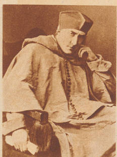
Lawrence Irving, Englands berühmtester Schauspieler, erkrankte auf der Rückfahrt von einer amerikanischen Gastspielreise beim Zusammenstoß seines Dampfers «Empress of Ireland» mit dem norwegischen Kohlenkessel «Storstad» im St. Lorenzostrom. Besonders tragisch bei diesem Fall ist folgender Umstand: Irving wollte ursprünglich mit der «Teutonic» seine Heimreise antreten und hatte bereits auf diesem Schiff einen Platz belegt. Im letzten Augenblick änderte er seinen Plan – niemand wußte warum. Er entschloß sich für die «Empress of Ireland», die nun sein Schicksalsschiff wurde.