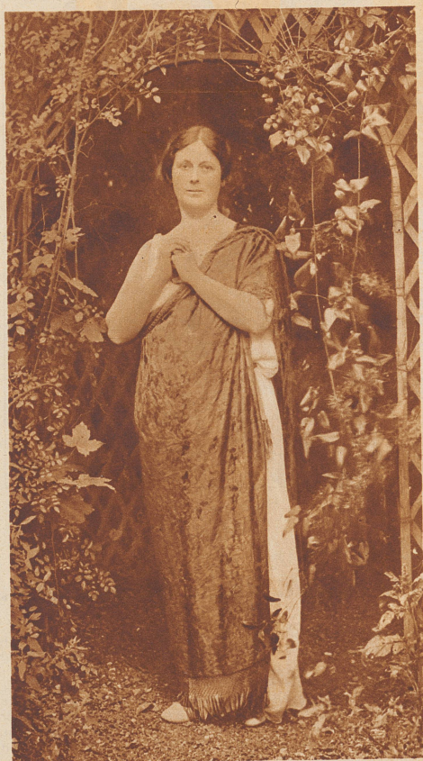
Isadora Duncan. Eine der größten Tänzerinnen der Vorkriegszeit. Sie stammte aus San Francisco. Nach dem Erdbeben von 1906 verließ sie ihre Heimat, kam nach Europa und feierte bei jedem Auftreten große Triumphe. Seit 1920 lebte sie an der französischen Riviera. Hier ereilte sie unter ganz sonderbaren Umständen der Tod: Die Tänzerin ließ bei einer Autofahrt ihren langen Schal frei im Winde flattern. Das fliegende Ende verfang sich in den Speichen eines Hinterrades, wickelte sich da auf und schnürte der Künstlerin den Hals so unglücklich zusammen, daß sie starb.