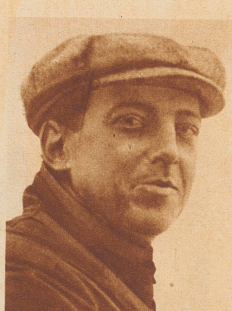
Hubert Latham, einer der ersten französischen Flieger, der in den Jahren 1908/1910 große Triumphe erlebte, starb ausnahmsweise nicht bei einem Flugunfall, wie unzählige seiner Kameraden, sondern im französischen Kongo, wo er seiner Passion, der Jagd auf Großwild, oblag, wurde er von einem Büffel aufgespießt.