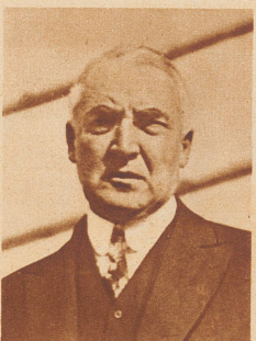
Warren G. Harding, der Nachfolger Wilsons in der Präsidentschaft Nordamerikas, starb auf einer Reise nach Alaska im August 1922 an den Folgen einer Fischvergiftung. Das war die offizielle Meldung, die durch die Presse ging. Später sind um diesen Todesfall eine Unmenge Gerüchte in Umlauf gebracht worden. In einem Buche, das in U.S.A. eine ungeheure Auflage erlebte, wurde sogar behauptet, seine Gattin hätte ihn vergiftet, um seine Ehre zu retten. Denn in der Tat war zu jener Zeit ein Riesenkorruptionsskandal am Ausbrechen, in welcher Affäre Harding arg kompromittiert wurde.