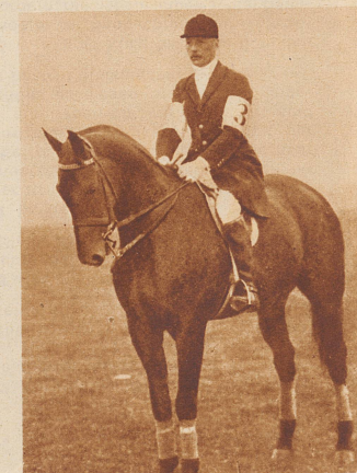
Prinz Sigmund von Preußen verunglückte tödlich durch einen Sturz vom Pferd beim Internationalen Concours Hippique in Luzern im Jahre 1929.