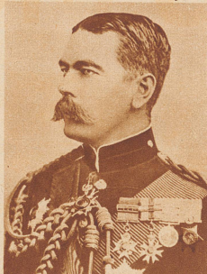
Lord Kitchener , der Eroberer des Sudans und Oberkommandierender der englischen Truppen im Burenkrieg, starb im Weltkrieg auf dem Kriegsschiff «Hampshire», das auf der Reise von England nach Archangelsk durch eine Mine in die Luft gesprengt wurde. Kitchener, der große Stratege, wollte sich nach Rußland begeben, um die dortige Kriegführung zu reorganisieren.