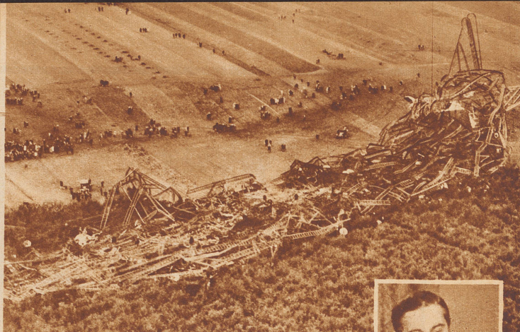
Die größte Luftschiffkatastrophe der Geschichte. Auf der Fahrt von England nach Indien stürzte in der Nacht vom 4. zum 5. Oktober 1930 bei Bauvais in Nordfrankreich das englische Luftschiff «R 101» ab und verbrannte. 38 Mann der Besatzung und 13 Passagiere kamen ums Leben. Unter den letzteren der englische Luftfahrtminister Lord Thomson. Die Ueberreste des «R 101» am Morgen nach der Katastrophe. — Rechts: Lord Christofer B. Thomson.