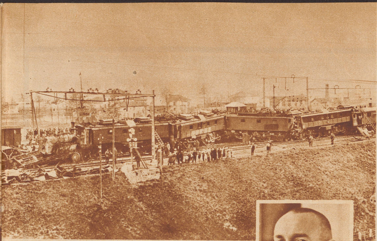
Die Eisenbahnkatastrophe von Bellinzona. Dieser Zusammenstoß von zwei Schnellzügen in der Nacht vom 23. zum 24. April 1924 war einer der schlimmsten Unglücksfälle, die auf dem Gebiete der Schweizerbahnen sich ereignet haben. Bei der Katastrophe fanden 6 Eisenbahner und 7 Passagiere den Tod, unter den letzteren der deutsche Wirtschaftsführer und Minister Karl Helfferich, der sich auf der Rückreise von Italien nach Deutschland befand. Rechts: Reichsminister Dr. Karl Helfferich.