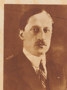
Maurice Bokanowsky, Handels- und Luftfahrtminister von Frankreich, fand den Tod im Jahr 1927 anlässlich einer Luftfahrt bei einem sonntäglichen Flugmeeting. Er war der erste französische Minister, der für seine Reisen regelmäßig das Flugzeug benutzte.