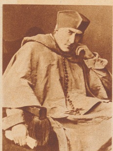
Lawrence Irving , Englands berühmtester Schauspieler, ertrank auf der Rückfahrt von einer amerikanischen Gastspielreise beim Zusammenstoß seines Dampfers «Empress of Ireland» mit dem norwegischen Kohlenkessel «Storstad» im St. Lorenzstrom. Besonders tragisch bei diesem Fall ist folgender Umstand: Irving wollte ursprünglich mit der «Teutonic» seine Heimreise antreten und hatte bereits auf diesem Schiff einen Platz belegt. Im letzten Augenblick änderte er seinen Plan — niemand wußte warum. Er entschloß sich für die «Empress of Ireland», die nun sein Schicksalsschiff wurde.