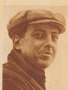
Hubert Latham , einer der ersten französischen Flieger, der in den Jahren 1908/1910 große Triumphe erlebte, starb ausnahmsweise nicht bei einem Flugunfall, wie unzählige seiner Kameraden, sondern im französischen Kongo, wo er seiner Passion, der Jagd auf Großwild, oblag, wurde er von einem Büffel aufgespießt.