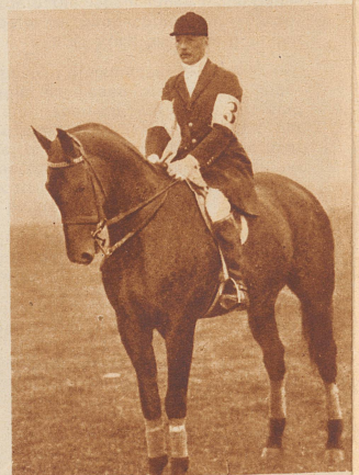
Prinz Sigmund von Preußen verunglückte tödlich durch einen Sturz vom Pferd beim Internationalen Concours Hippique in Luzern im Jahre 1929.

Es liegt immer eine eigenartige Tragik darin, wenn bei einem Unglück, das durch Naturereignisse oder durch andere Umstände hervorgerufen wird, eine Persönlichkeit den Tod findet, die im Vordergrund des öffentlichen Interesses steht. Allerdings, die Zahl großer Männer, die im Laufe der Geschichte durch unglückliche Zufälle ums Leben gekommen sind, erscheint nicht sehr groß. Sie kann auch gar nicht groß sein, denn bedeutende Köpfe sind niemals zahlreich gesät gewesen. Aber jedesmal, wenn so ein Großer mit unter den Opfern irgendeiner Schiffs- oder Eisenbahnkatastrophe zu finden ist oder sonst unter außerordentlichen Umständen einen rapiden Tod gefunden hat, dann ist es, als züde das Weltgewissen für einen Augenblick schmerzlich zusammen, dann ist es, als würde es sich selbst darüber, daß einer, dem vielleicht noch mancherlei zum Wohle der Menschheit zu tun übriggeblieben wäre, so unbarbarisch herabberufen wurde.