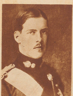
Alexander I. , König von Griechenland. Als 1917 König Konstantin, der Schwager Wilhelms II., auf Drängen der Entente die Regierung niederlegen mußte, folgte ihm sein zweiter Sohn als Alexander I. auf den Thron. Die Herrschaft des jungen Königs dauerte nicht lange. Eines Tages wurde er bei einem Spaziergang im Park seines Schlosses von einem Affen gebissen. An den Folgen dieses Bisses starb er kurze Zeit nachher. Die öffentliche Meinung hat die Erklärung dieser Todesursache immer mit Mißtrauen aufgenommen. In der Tat gehört diese Königstragödie nicht nur in die Reihe der zufälligen, sondern ebenso der mysteriösen Todesfälle.