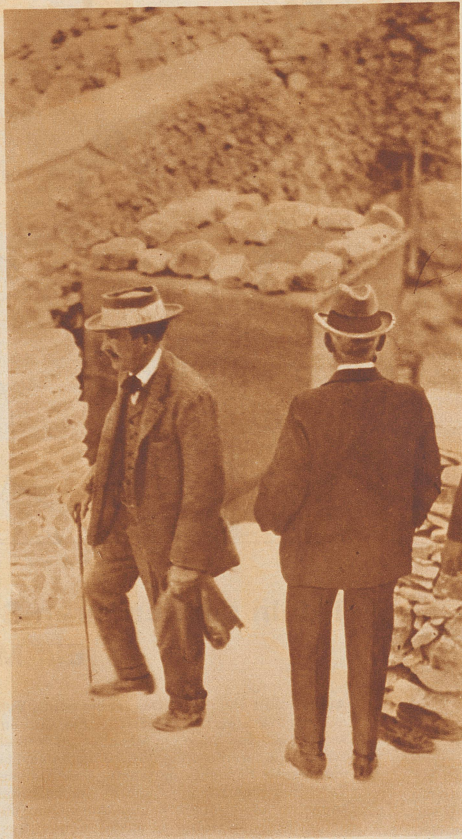
Lord Carnarvon. Der große englische Aegyptologe und Entdecker des Tutankhamon-Grabes wurde bei seinen Ausgrabungsarbeiten das Opfer eines giftigen Insektenstiches.

Es liegt immer eine eigenartige Tragik darin, wenn bei einem Unglück, das durch Naturereignisse oder durch andere Umstände hervorgerufen wird, eine Persönlichkeit den Tod findet, die im Vordergrund des öffentlichen Interesses steht. Allerdings, die Zahl großer Männer, die im Laufe der Geschichte durch unglückliche Zufälle ums Leben gekommen sind, erscheint nicht sehr groß. Sie kann auch gar nicht groß sein, denn bedeutende Köpfe sind niemals zahlreich gesät gewesen. Aber jedesmal, wenn so ein Großer mit unter den Opfern irgendeiner Schiffs- oder Eisenbahnkatastrophe zu finden ist oder sonst unter außerordentlichen Umständen einen rapiden Tod gefunden hat, dann ist es, als züde das Weltgewissen für einen Augenblick schmerzlich zusammen, dann ist es, als würde es sich selbst darüber, daß einer, dem vielleicht noch mancherlei zum Wohle der Menschheit zu tun übriggeblieben wäre, so unbarbarisch herabberufen wurde.