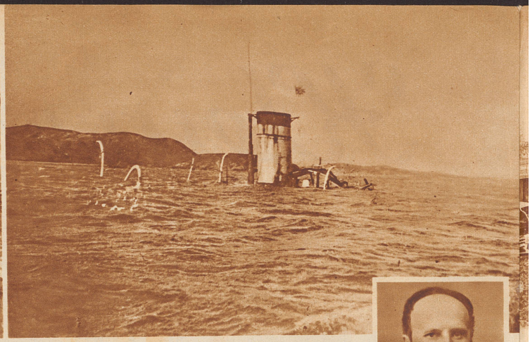
Das russische Flaggschiff «Petropawlowsk» auf dem Meeresgrund vor Port Arthur. Dieser Panzerkreuzer wurde am 13. April 1904 im russisch-japanischen Krieg von den Japanern in den Grund gebohrt. An Bord des Schiffes befand sich der berühmte russische Schlachtenmaler Wassilij Wereschtschagin. Er ertrank. — Rechts: Wassilij Wereschtschagin .