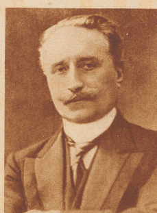
Paul Deschanel, Präsident von Frankreich, stürzte aus einem fahrenden Schnellzug. Bis heute sind die näheren Begleitumstände dieses Unfalls nicht restlos geklärt. Jedenfalls ist Deschanel nach der verhängnisvollen Nacht schwer geschädigt ins Elysée zurückgekehrt und starb bald an den Folgen des geheimnisvollen Eisenbahnunfalles.