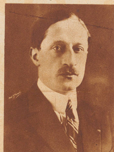
Maurice Bokanowsky , Handels- und Luftfahrtminister von Frankreich, fand den Tod im Jahr 1927 anlässlich einer Luftfahrt bei einem sonntäglichen Flugmeeting. Er war der erste französische Minister, der für seine Reisen regelmäßig das Flugzeug benutzte.