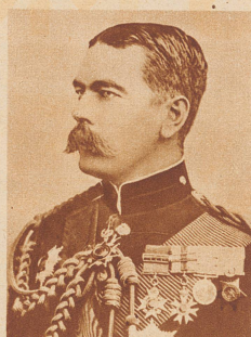
Lord Kitchener, der Eroberer des Sudans und Oberkommandierender der englischen Truppen im Burenkrieg, starb im Weltkrieg auf dem Kriegsschiff «Hampshire», das auf der Reise von England nach Archangelsk durch eine Mine in die Luft gesprengt wurde. Kitchener, der große Strategie, wollte sich nach Rußland begeben, um die dortige Kriegführung zu reorganisieren.