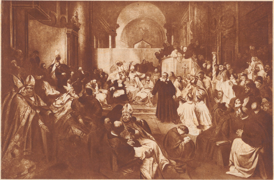
«Galilei vor dem Konzil», Gemälde von K. Hausmann.

Galilei war nie vor einem Konzil und er hat auch nicht jenen entrüsteten Ruf «E pur si muove» (und sie bewegt sich doch) ausgestoßen. Der große Italiener ist durch jenen Prozeß von 1633 eigentlich erst recht berühmt und Gegenstand vieler märchenhafter Erzählungen geworden. Auch seine Pendelversuche in Pisa, seine Fallversuche vom schiefen Turm dort sind als Märchen erwiesen. Am 24. Juni 1633 wurde der wissenschaftliche Märtyrer in Rom von der Inquisition verurteilt, abzuschwören, daß er an die Bewegung der Erde glaube.