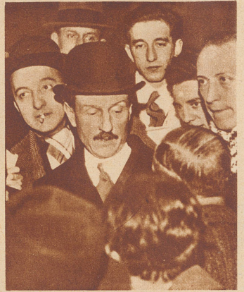
Chautemps nach der Regierungserklärung. Der französische Ministerpräsident beim Verlassen der Kammer, von Journalisten umringt.