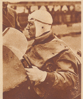
Vier Fliegen auf einen Schlag. Auf der Bahn von Monthlery hat der französische Rennfahrer Zander vier Geschwindigkeitsrekorde mit der selben Fahrt gebrochen: den 50- und 100 Kilometer- und den 50- und 100 Meilen-Rekord.