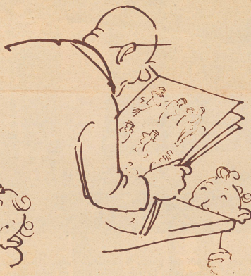
Eh — de Gigerliheiri