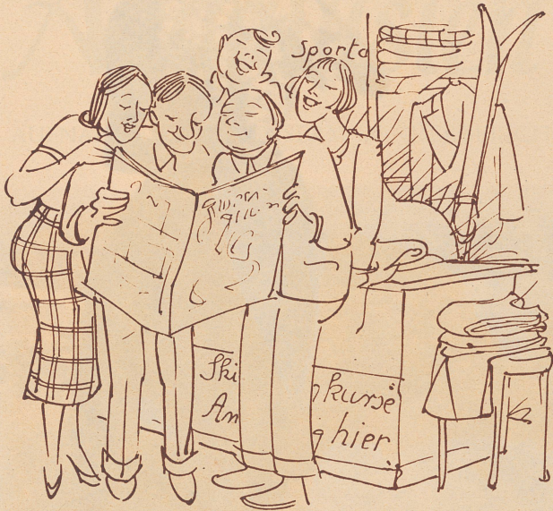
Am Freitag am Morgen im Sportgeschäft. Die neu Nummere vo der Zürcher