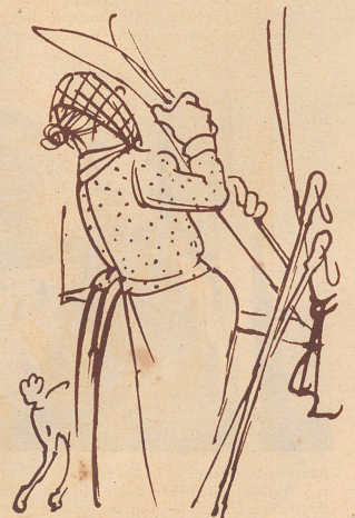
Hä nu, so gänd sie! Am Änd cha de Heiri e neus Gschtell drus mache. Er mues doch alli wil öppis gschrineret ha.