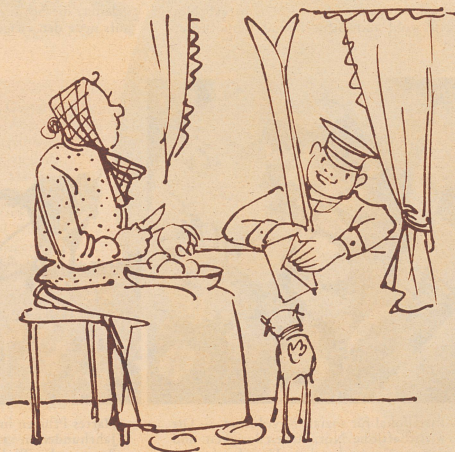
Für de Heiri? Hölzer? Mer brauchet kei! Mer händ s'Elektrisch i der Chuchi!