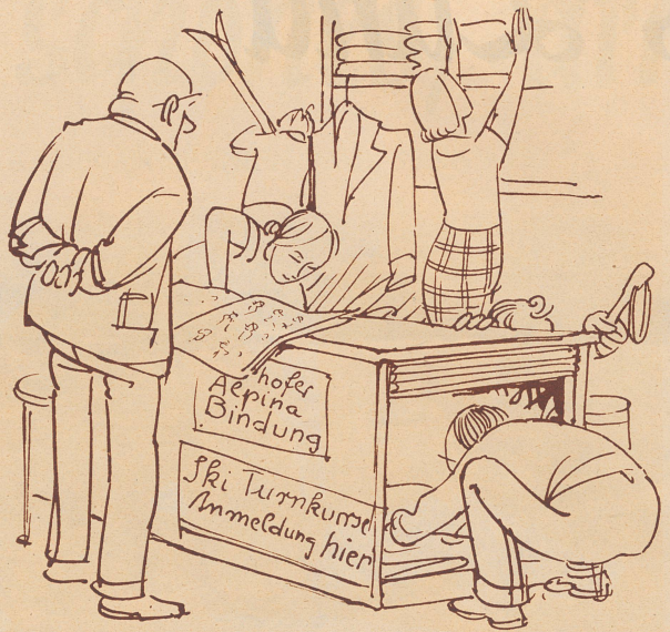
Ohä, de Chef chunnt