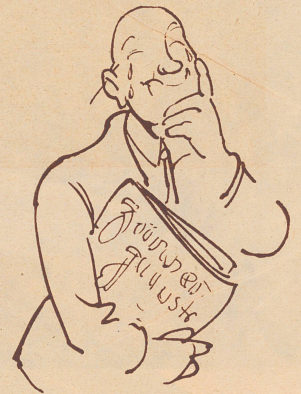
En Idee! De Heiri mueß e Paar Ski ha! Gratis. Ich nimm es uf Reklamekonto