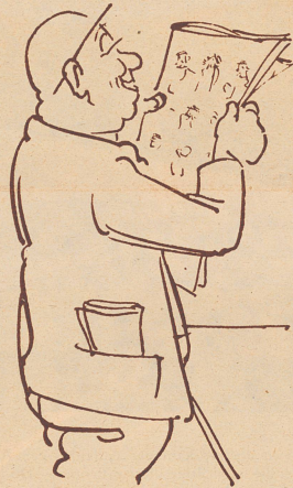
Glatt! Glatt! Zum Schüüße!