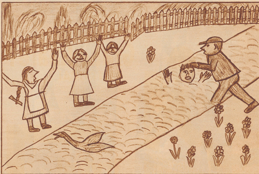
Da seht ihr e i n e aus allen vielen Zeichnungen, irgendeine, wahllos herausgegriffen. Sie ist nicht etwa die beste, sie hat nicht einmal einen Preis erhalten, aber sie ist lustig, und sie ist ganz sicher vom Adolf allein gemacht worden. Und darum gefällt sie mir.