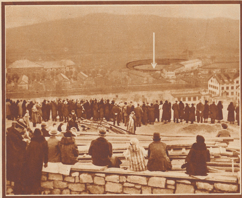
25 000 Menschen im Stadion. Tausende draußen auf den Höhen, auf unvollendeten Neubauten, auf Bäumen und Dächern. Bild: Blick vom Waidberg hinunter aufs Kampffeld.