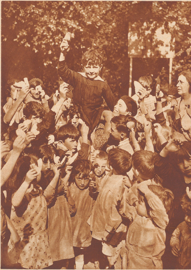
Da seht ihr alle die Kinder, die auf ihre Znüni-Schokolade verzichtet haben, um armen Kameraden zu helfen. Den kleinen Jungen, der die prächtige Idee gehabt hat, haben sie auf ihre Schultern gehoben.