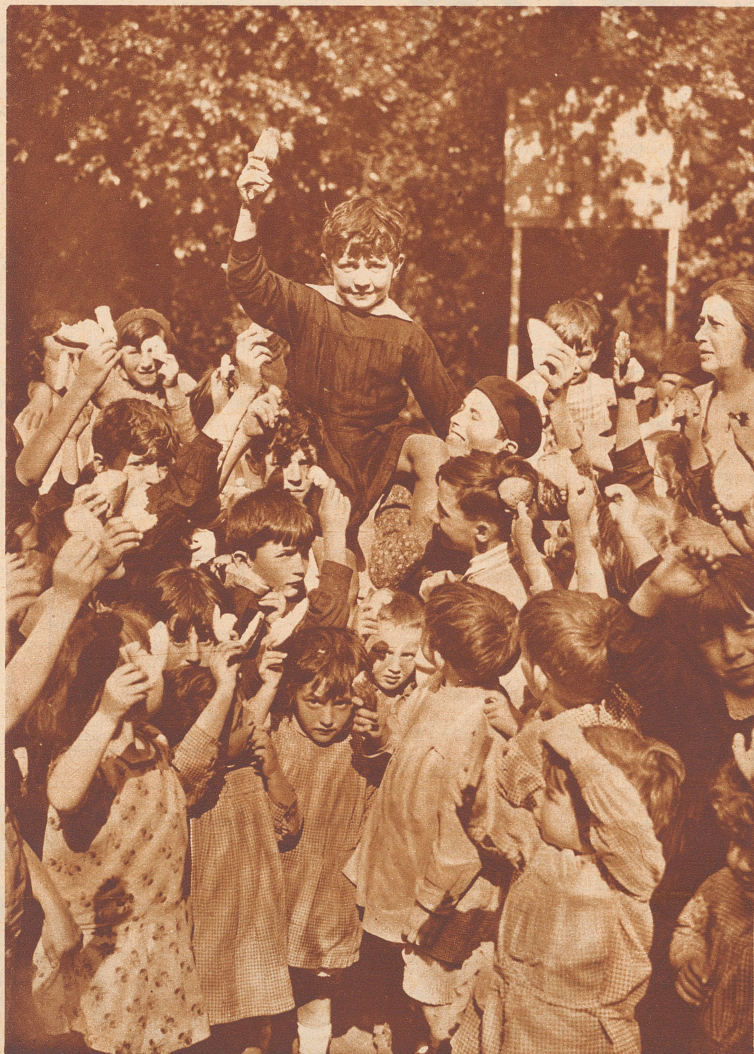
Da seht ihr alle die Kinder, die auf ihre Znüni-Schokolade verzichtet haben, um armen Kameraden zu helfen. Den kleinen Jungen, der die prächtige Idee gehabt hat, haben sie auf ihre Schultern gehoben.