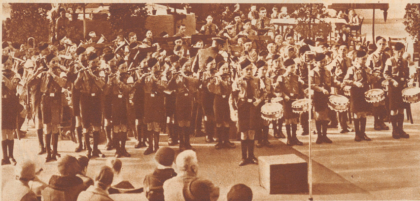
Die Buben von Klingenthal haben in der Hauptstadt ein großes Konzert gegeben, und die Einnahmen davon haben sie den Arbeitslosen in ihrer Stadt gespendet.