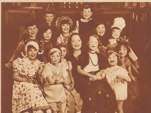
Vor drei Jahren in Berlin . . .