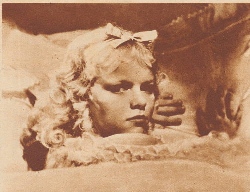
. . . heute in Hollywood

Hier sitzt sie auf Mutters Schoß, denn Mutter – die eben durch den blauen Engel berühmt gewordene Marlene Dietrich – fährt nach Hollywood und die kleine Maria durfte ihre Spielkameraden zum Abschiedstee bei sich haben.