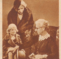
wodurch Bleichen überflüssig wird. Nurb blond erhält Babys goldige Locken.“

Kinderhaar, das von frühesten Jugend an mit Nurb blond, dem Spezial-Shampoo für Blondinen gepflegt wird, wird immer leicht und schimmernd bleiben. Denn Nurb blond nimmt auf die feine empfindliche Struktur naturblonden Haares besondere Rücksicht und verhindert das Nachdunkeln naturblonden Haares. Es gibt auch bereits nachgedunkeltem und farblos gewordenem Blondhaar den ursprünglichen Goldglanz zurück. Enthält keine Färbemittel, keine Henna und ist frei von Soda und allen schädlichen Bestandteilen. Überall erhältlich. Versuchen Sie es noch heute.