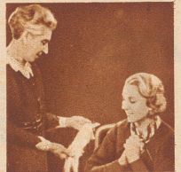
„So blond warst Du auch als Kind. Schade, Dein blondes Haar ist dunkel geworden.“