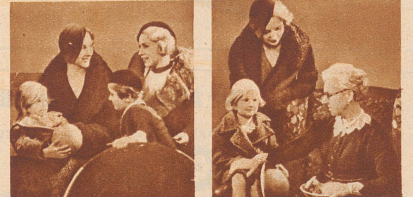
„Heutzutage braucht blondes Haar nicht dunkel zu werden. Endlich gibt es ein Mittel...“