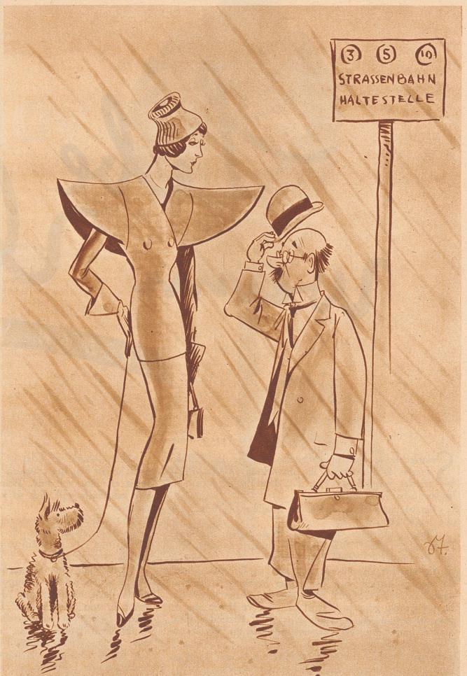
Zeichnung von W. Steinberg

«Herr Richter, bevor er mir den Schlag gab, war er kein Wrack.»