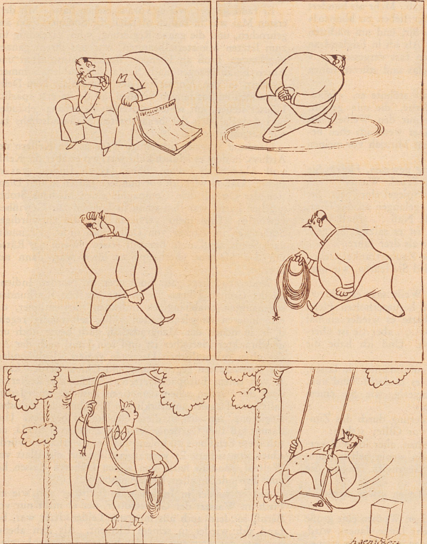
Kleine Geschichte ohne Worte.

«Ja, wenn alle hineingehen, gehen nicht alle hinein. Aber wenn nicht alle hineingehen, dann gehen alle hinein. Es gehen aber nicht alle hinein!»