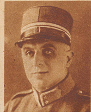
Giuseppe Galli , Gemeinde-Vizepräsident von Chiasso, starb 52 Jahre alt. Er gehörte mehrere Amtsperioden dem tessinischen Großen Rat an und spielte eine bedeutende Rolle im politischen und wirtschaftlichen Leben des Mendrisiotto. In der Armee bekleidete er den Grad eines Oberstleutnants der Verpflegungsgruppen.