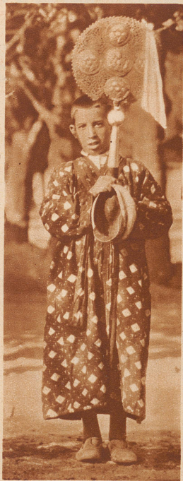
Ein Jüngling aus der Verwandtschaft, in rotem, kimonoartigem Mantel, trägt im Trauerzug ein goldenes Symbol mit.

In einem bulgarischen Dorf stirbt eine Bäuerin. 74 Jahre ist sie alt geworden. Auch sie wird mit zwei weißen Pferden auf dem landesüblichen Totenwagen zur letzten Ruhestätte gefahren. Die Eigenart bei dieser Beerdigungsfeier: die Musikanten. Ohne lustige Musik gibt es auf dem Balkan keine Tauf-, keine Hochzeits-, aber auch keine Totenfeier.