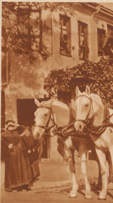
Der Trauerzug vor dem Hause der Verstorbenen. Der Pope hat eben sein Gebet beendet, die Angehörigen zeigen keine sonderlich betrübten Mienen, der Zug setzt sich zur letzten Fahrt der Verstorbenen, — zum Friedhof, — in Bewegung.