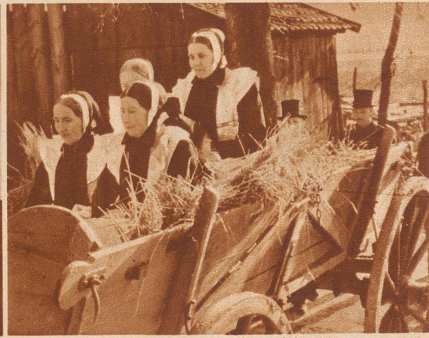
Die weiblichen Verwandten fahren auf dem Totenwagen mit. Die Witwe des Verstorbenen sitzt auf dem Sarg.