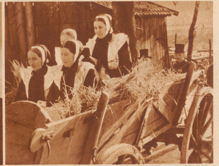
Die weiblichen Verwandten fahren auf dem Totenwagen mit. Die Witwe des Verstorbenen sitzt auf dem Sarg.