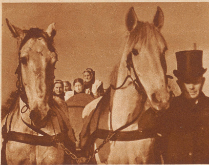
Der nächste männliche Verwandte des Verstorbenen führt die Pferde.