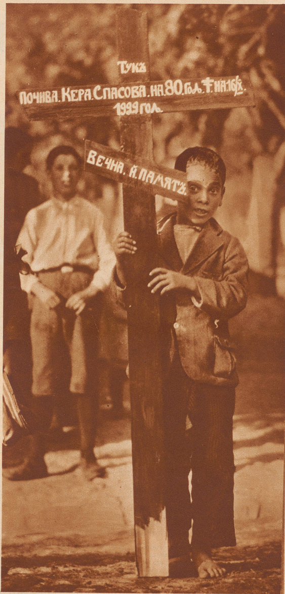
An der Spitze des Trauerzuges marschiert ein Dorfjunge mit einem großen Holzkreuz. Darauf sind in bulgarischer Inschrift Namen und Todestag der Verstorbenen eingezeichnet

In einem bulgarischen Dorf stirbt eine Bäuerin. 74 Jahre ist sie alt geworden. Auch sie wird mit zwei weißen Pferden auf dem landesüblichen Totenwagen zur letzten Ruhstätte gefahren. Die Eigenart bei dieser Beerdigungsfeier: die Musikanten. Ohne lustige Musik gibt es auf dem Balkan keine Tauf-, keine Hochzeits-, aber auch keine Totenfeier.