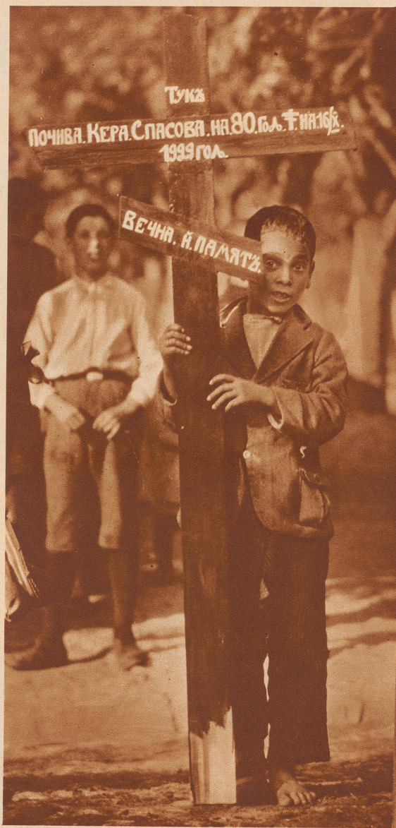
An der Spitze des Trauerzuges marschiert ein Dorfjunge mit einem großen Holzkreuz. Darauf sind in bulgarischer Inschrift Namen und Todestag der Verstorbenen eingezeichnet.