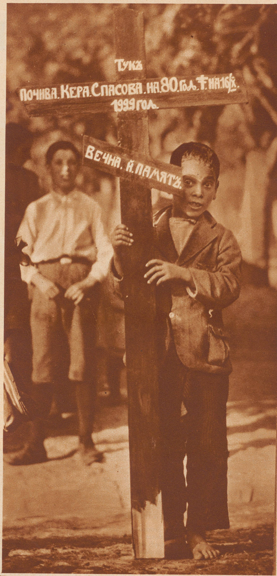
An der Spitze des Trauerzuges marschiert ein Dorfjunge mit einem großen Holzkreuz. Darauf sind in bulgarischer Inschrift Namen und Todestag der Verstorbenen eingezeichnet

In einem bulgarischen Dorf stirbt eine Bäuerin. 74 Jahre ist sie alt geworden. Auch sie wird mit zwei weißen Pferden auf dem landesüblichen Totenwagen zur letzten Ruhstätte gefahren. Die Eigenart bei dieser Beerdigungsfeier: die Musikanten. Ohne lustige Musik gibt es auf dem Balkan keine Tauf-, keine Hochzeits-, aber auch keine Totenfeier.