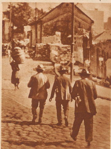
Balkan-Begräbnisfeier. Drei Musikanten begeben sich ins Trauerhaus. Bis in die späte Nacht hinein wird nach der Beerdigung im Hause der Verstorbenen musiziert, gesungen, getrunken.

In einem bulgarischen Dorf stirbt eine Bäuerin. 74 Jahre ist sie alt geworden. Auch sie wird mit zwei weißen Pferden auf dem landesüblichen Totenwagen zur letzten Ruhestätte gefahren. Die Eigenart bei dieser Beerdigungsfeier: die Musikanten. Ohne lustige Musik gibt es auf dem Balkan keine Tauf-, keine Hochzeits-, aber auch keine Totenfeier.