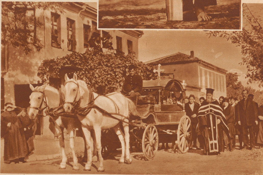
Der Trauerzug vor dem Hause der Verstorbenen. Der Pope hat eben sein Gebet beendet, die Angehörigen zeigen keine sonderlich betrübten Mienen, der Zug setzt sich zur letzten Fahrt der Verstorbenen, - zum Friedhof, - in Bewegung.