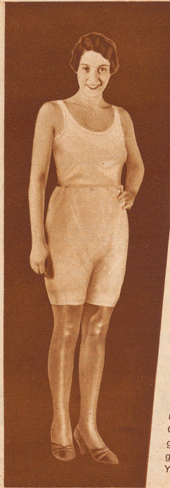
Hemd und Hose aus feinstem Wolltricot mit Flor, Sunbe- handelt(*). Die angenehmste Wäsche für kühle Tage.