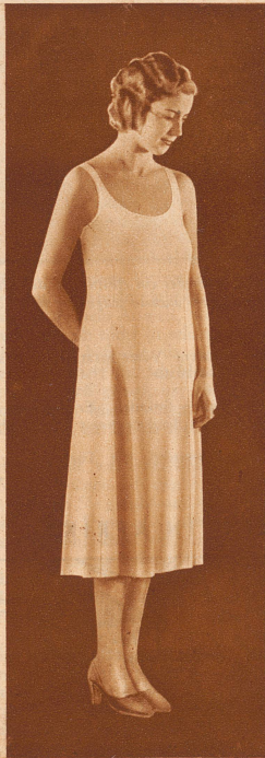
Einfacher, praktischer, aber den- noch tadellos sitzender Yala- Prinzessrock aus plattiertem Tricot: Wolle mit Kunstseide.