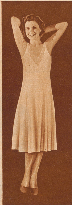
In die Taille geschnittener, gut sit- zender Prinzessrock aus Wolle mit Kunstseide. Einsatz aus tüllähnli- chem Tricotstoff.