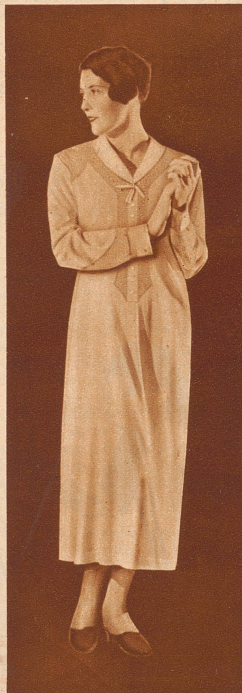
Elegantes Tricot-Nachthemd aus feiner Wolle plattiert mit Flor; an- genehm mollig, auch für die emp- findlichste Haut.