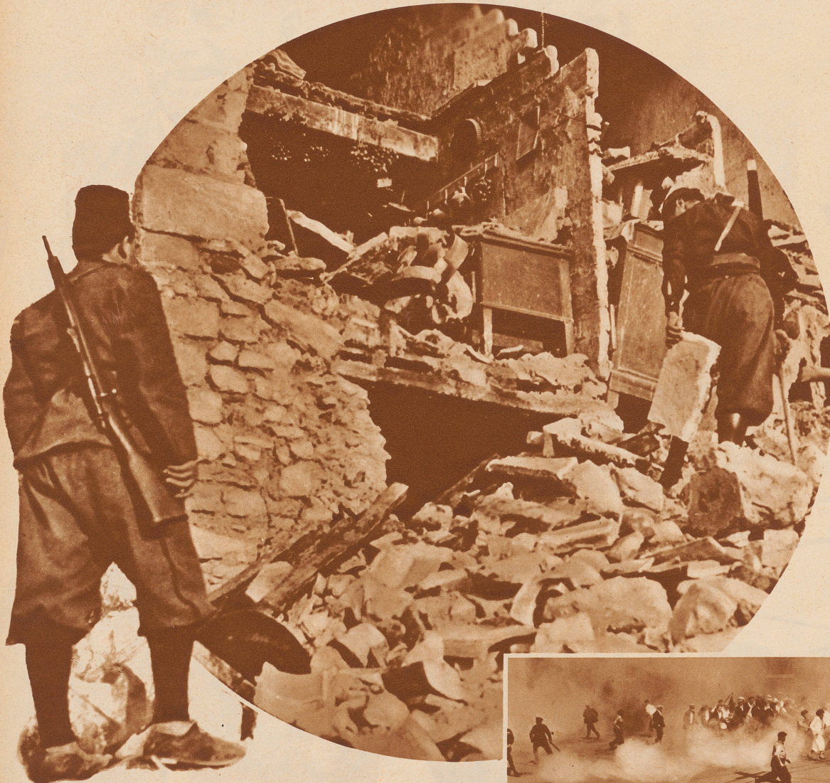
Das Erdbeben in den Abruzzen. Eines der bekanntesten Erdbebengebiete Italiens, die Abruzzen, sind vergangene Woche von starken Erdstößen heimgesucht worden. Am schwersten sind die Städte Solmona, Lama dei Peligni und Taranta betroffen. Im Ganzen sind 12 Personen umgekommen. Der Materialschaden ist bedeutend. Unser Bild zeigt ein eingestürztes Haus in der Ortschaft Solmona. Ganz deutlich ist die leichte Bauart dieser Gegend erkennbar. Der angeschnittene Raum links ist eine typische süditalienische Küche. An der Wand hängen die Kochgeräte, am Deckenbalken frischegeerntete Trauben. Faschistische Polizei durchsucht die Trümmerstätte