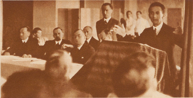
Dr. Goebbels, der deutsche Propagandaminister, rechtfertigt vor den Vertretern der Internationalen Presse in Genf das Verhalten seiner Regierung und deutet mit bereiteter Zunge das Wesen des Dritten Reiches. Die Presseleute bewahren seinen Erläuterungen gegenüber eine spürbare Zurückhaltung