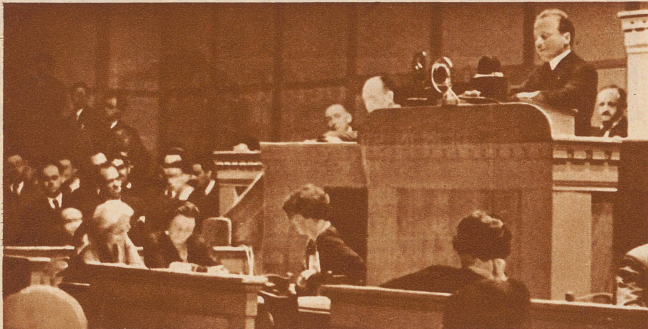
Dr. Dollfuß, der österreichische Bundeskanzler, der sich eben erst zum Diktator umgewandelt hat, spricht vor der Völkerbundsversammlung in Genf. Er war bei seinem Auftreten im Kreise der internationalen Politiker und Diplomaten der Mittelpunkt auffallend starker Sympathieumgebungen