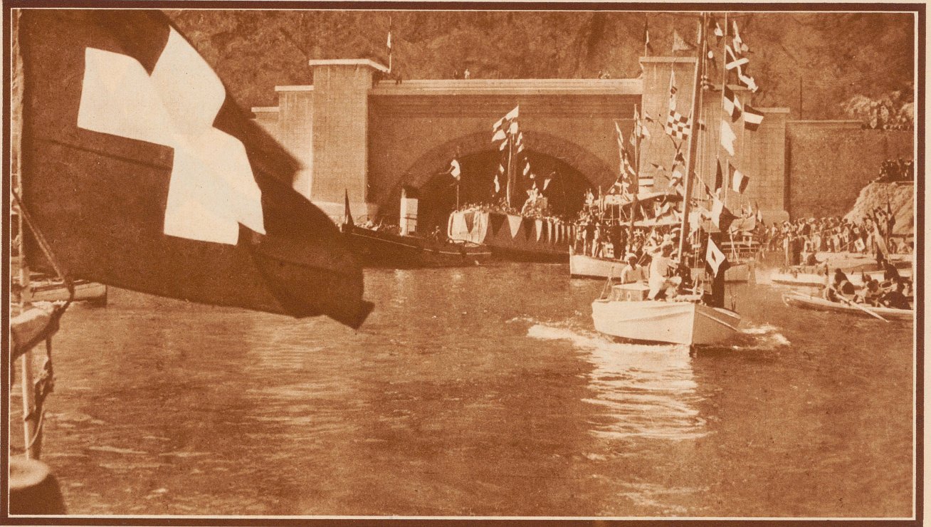
Rhonefest in Marseille. Vous êtes Suisse? Vous êtes Français??? Non Monsieur, je suis Rhodanien! Ich bin ein Rhone-Wesen. Ein Rhönlér, ein Angehöriger also der großen Rhonefamilie derer, die längs der Rhone leben; dies ist auch eine Verbundenheit, eine andere als die der Nationalismen von heute. – Diese Verbundenheit ist der Sinn des großen Rhonefestes, das eben in Marseille unter starker Beteiligung auch aus dem Wallis, aus der Waadt und Genf gefeiert wurde. Bild: Ofrande au Rhône, Huldigung der Rhone am Rhone-Tunnel im Port Estagues in Marseille. Das Rhoneboot, auf dem auch die Schweizerfahne flattert, wird aus dem Tunnel des Rhonekanals gezogen